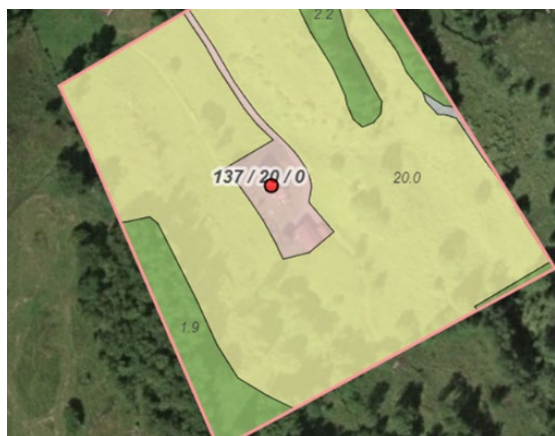
Gult areal: innmarksbeite

Bilde 2 er flyfoto over eigedom frå 2020 og tilsvarende foto frå 2000