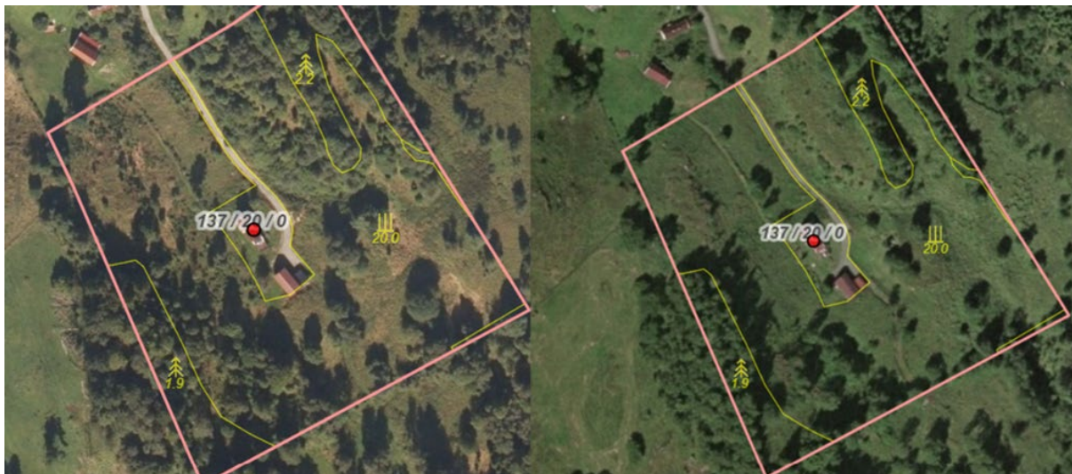
Skarsvegen 29 i år 2020