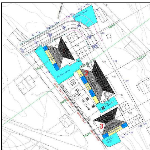
Illustrasjonen over viser hvilke arealer innenfor planområdet som vil kunne brukes og vi har medregnet som felles uteoppfallsarealer.

Framlegg til reguleringsplan viser ikkje til felles uteoppfallsareal i plankartet. Felles uteoppfallsareal er vist til i utklipp som ein finn i planskildringa, samt det er nokre få føresegn som omtalar felles uteoppfallsareal.