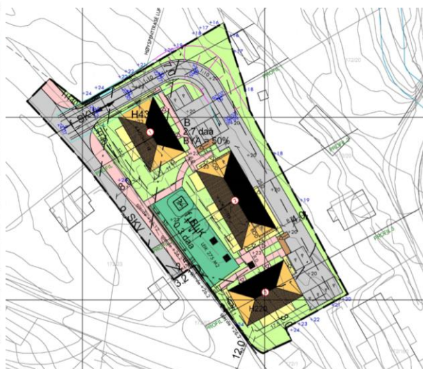
Utklipp frå illustrasjonsplan

I planskildringa punkt 6.11 viser ein til at det er rekna til saman 716 m 2 uteoppfallsareal fordelt på privat og felles. Balkongstorleik på 12,5 m 2 og markterassestorleik på 20,5 m 2 er storleikar som verkar hensiktsmessige. Dette er privat uteoppfallsareal.