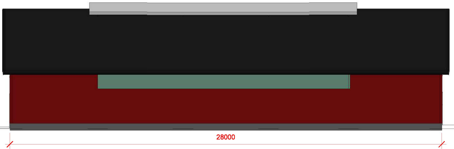
1 Øst 1 : 125