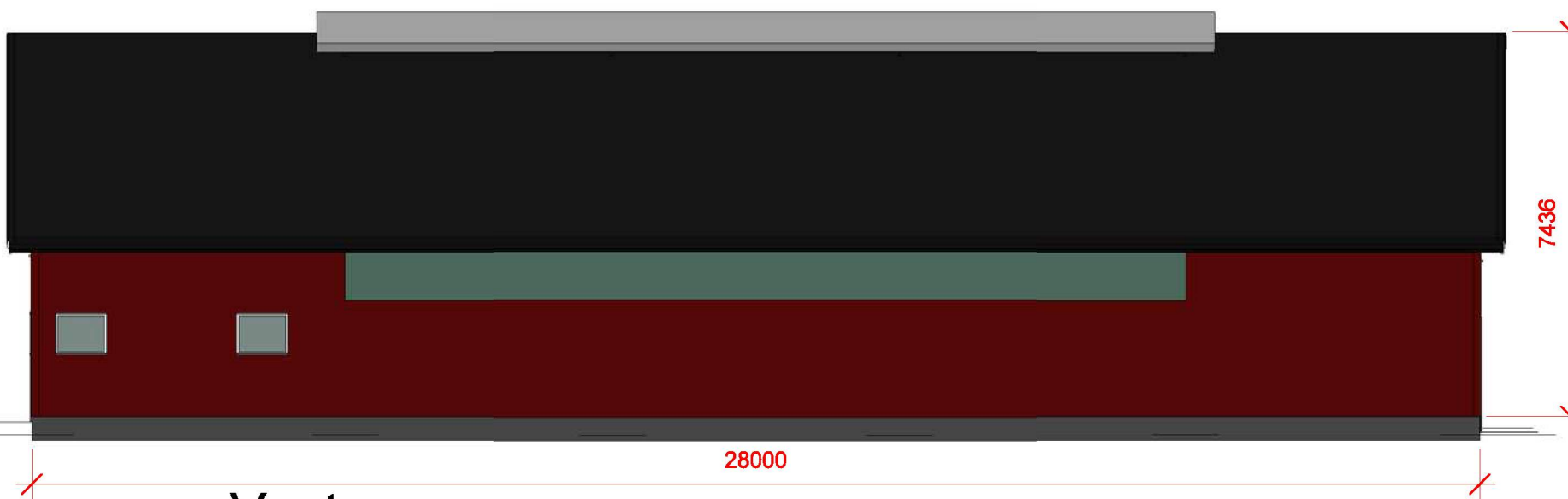
2 Vest 1 : 125