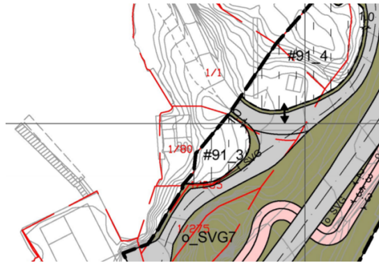
Figur 2: Område #91_3 avsett til mellombels anlegg- og riggområde

I vedtak av 14.01.2020 gir Alver kommune avslag på søknad om dispensasjon for bruksendring frå naust til næring - gbnr 1/ 80 Flatøy.