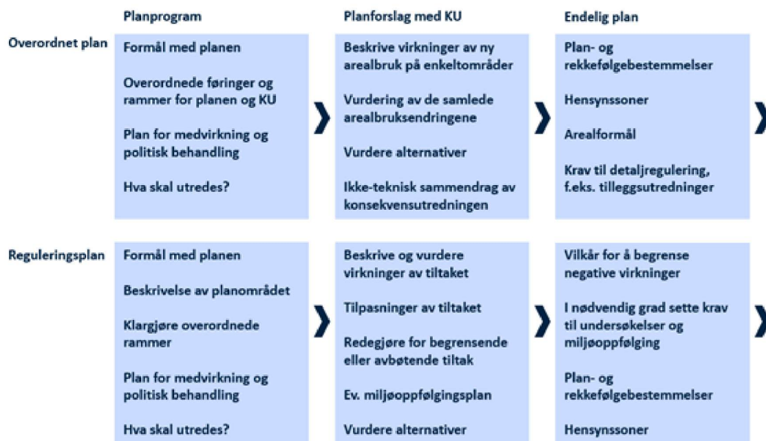
Figur 4.1 Illustrasjon av ulike tilnærminger i planprogram/konsekvensutredning for overordnet plan (kommuneplanens arealdel, kommunedelplan) og detaljregulering.

Plan- og bygningsloven § 4-1 stiller krav om planprogram for alle regionale planer, kommune(del)planer, og for reguleringsplaner som kan få vesentlige virkninger for miljø og samfunn. Det er KU-forskriften som fastsetter hvilke reguleringsplaner dette gjelder. Reguleringsplaner som omfattes av vedlegg I til forskriften skal alltid ha planprogram og konsekvensutredning. For reguleringsplaner som omfattes av vedlegg II, og som er vurdert til å falle inn under KU-plikten, er det ikke krav til planprogram jf. § 8 bokstav a.