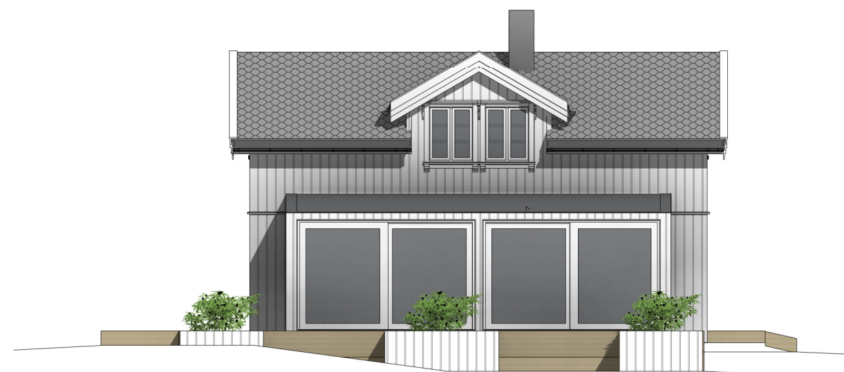
sør 1 : 100