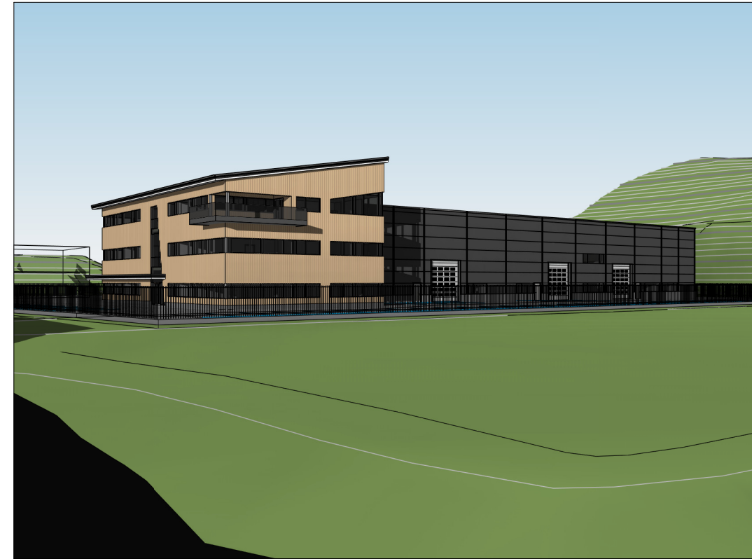
Perspektiv fra sørlige tomte hjørne