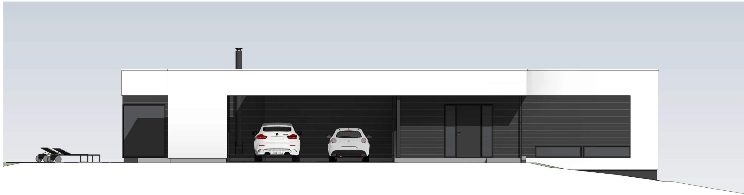
nordvest 1 : 100