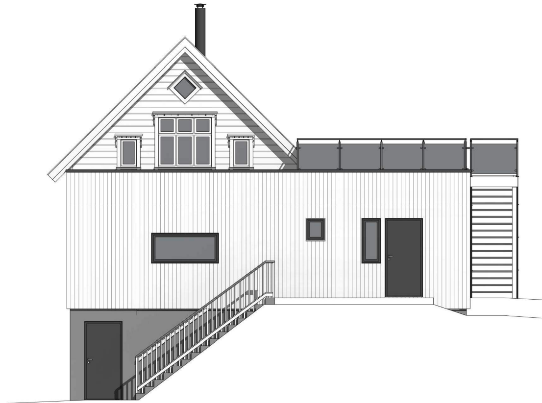
nordøst 1 : 100