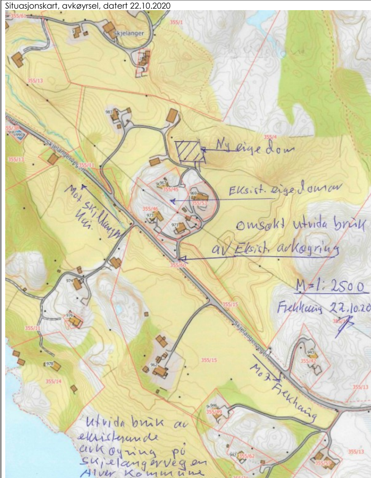
Situasjonskart, avkøyrsel, datert 22.10.2020