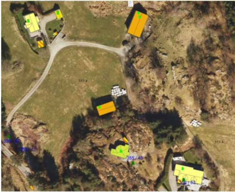
Bilde 1 er situasjonskart fra søknad og bilde 2 er flybilde same stad. Tomten er plassert høge som er definert som inmarksbeite i gardskart.