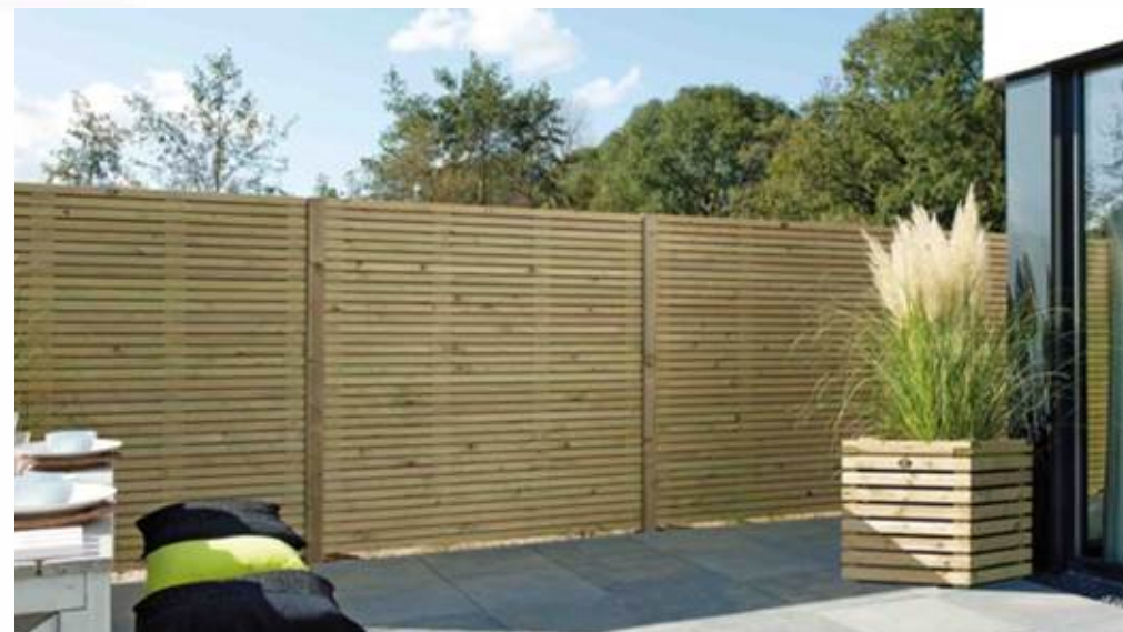
Tilsvarende utseende på skjerm som dette, men med felt med plexiglass oppe, som vist på bildet til venstre.