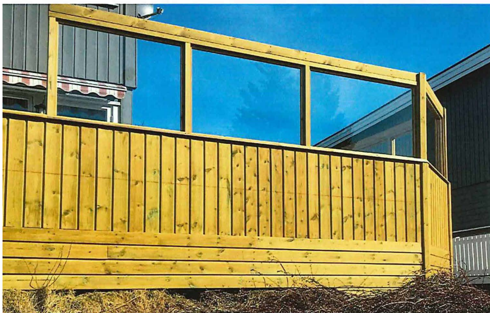
Eksempel støyskjerm. Her med både liggende og stående kledning og plexiglass i toppen