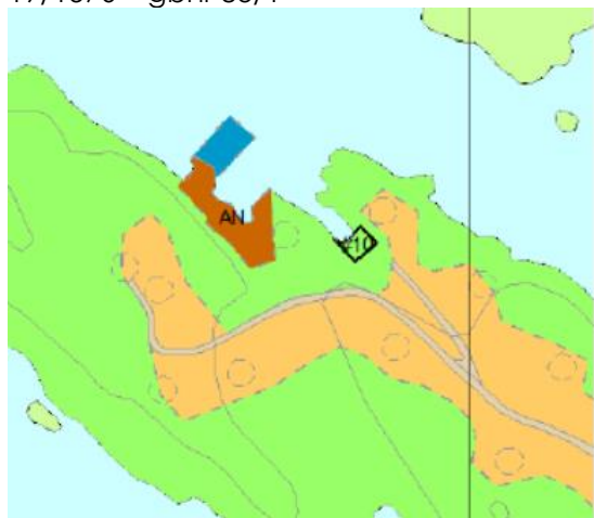
Plassering av naust innafor #10 i arkivsak 19/1570 – gbnr 83/1