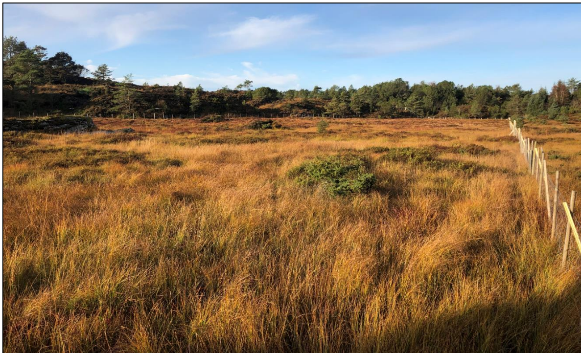
Figur 8: Myr 1. Bildet er tatt mot vest.