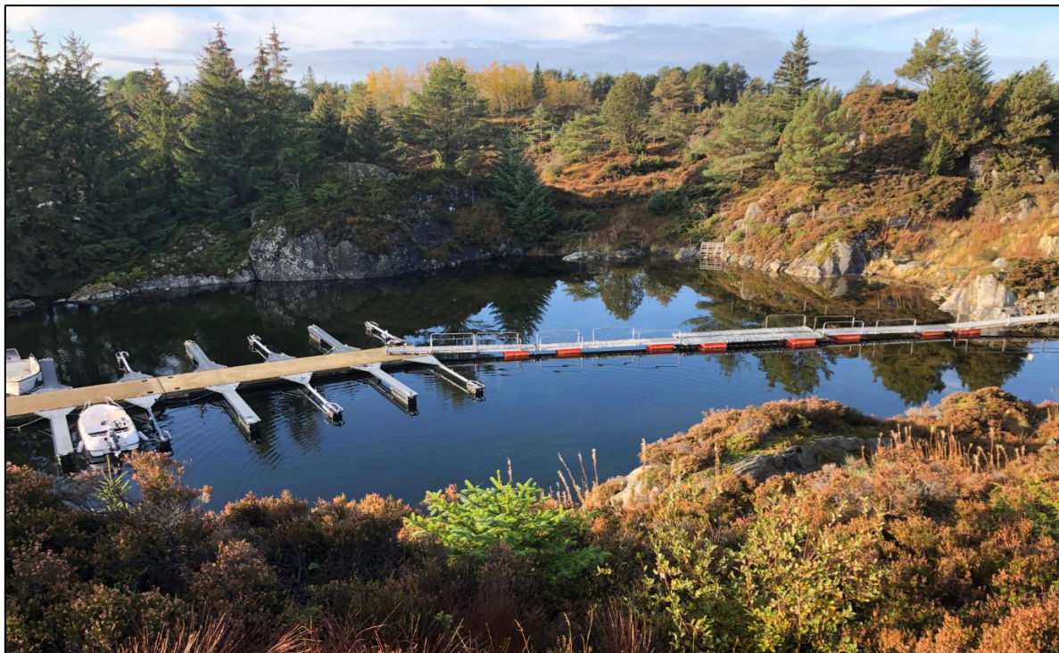
Figur 9: Bakerst i bildet vises området vest/sørvest for båthavnen. Til høyre i bildet sees området hvor det var flere store trær og busker av furu og eier, mens til venstre vises deler av neset hvor det var tett forekomst av sitkagran.