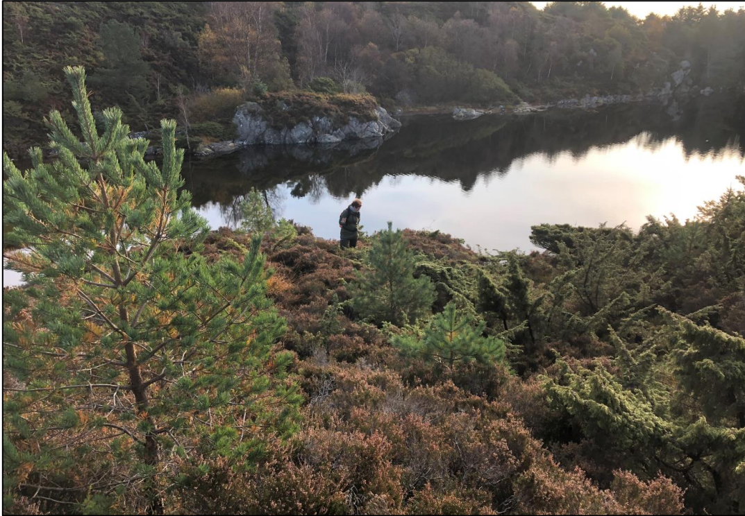
Figur 6: Kolle 2 hvor det generelt var kraftigere røsslyng og tettere bestander av busker og trær (einer, furu, bjørk, rogn, buskfuru og sitkagran). Bildet er tatt mot vest.