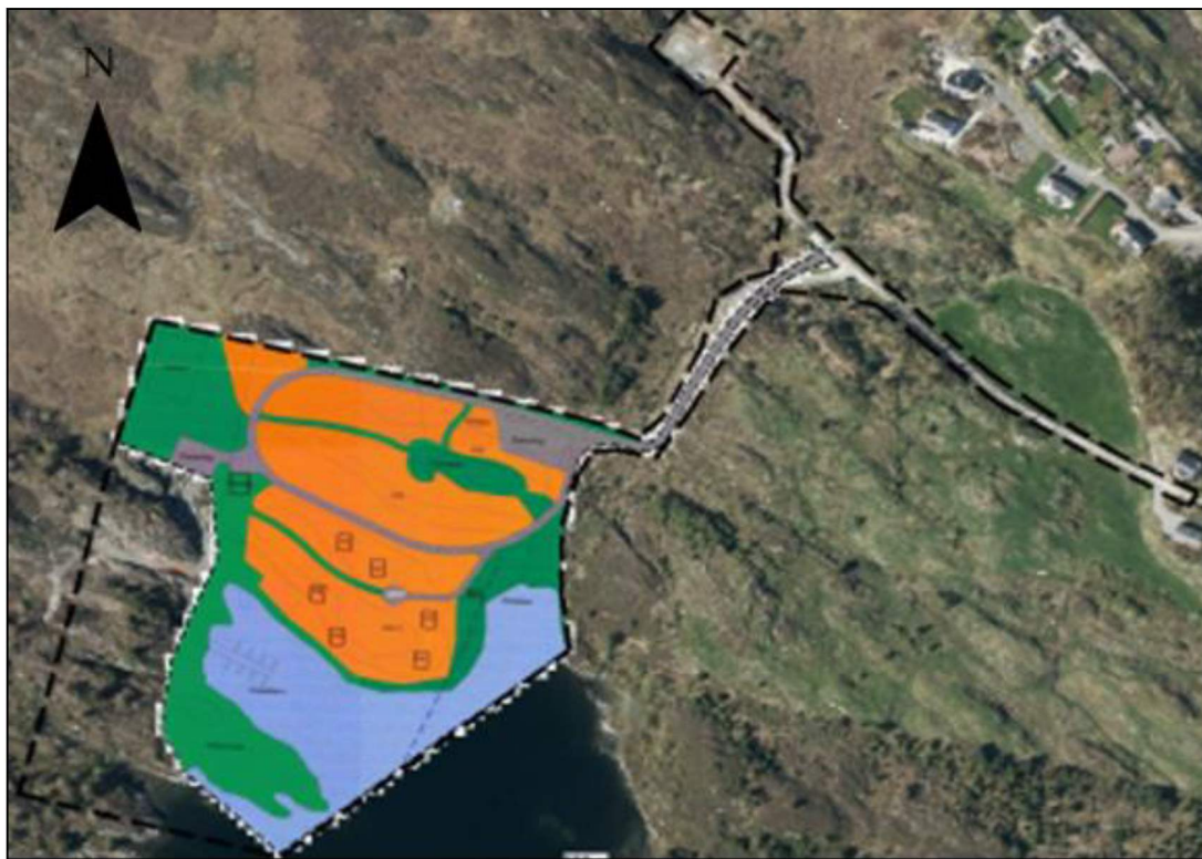
Figur 2: Sort stiplet linje viser avgrensning av planområdet. Oransje felt viser områder som er satt av til hytteutbygging i gjeldende plan.