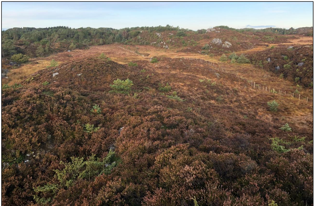
Figur 5: Kolle 1. Bildet er tatt mot vest og viser vegetasjonen med dominert av middels grov røsslyng og spredte forekomster av sitkagran og buskfuru.

Nordre del av planområdet inkluderer delområdene kolle 1, kolle 2, kolle 3 og myr 1, og består hovedsakelig av koller med lynghei, samt en større myrflate (figur 4). På kollene er artssammensetningen i lyngheia dominert av middels til kraftig røsslyng i feltsjiktet. Jordsmonnet er skrint og det stikker flere steder opp berg i dagen. I tillegg til røsslyng opptrer arter som finnskjegg, einer, mjølbær, blokkebær, tepperot, klokkeling, rome, tyttebær, samt sisselrot og vivindel på kolle 2. De fremmede artene sitkagran og buskfuru ble observert spredt på alle kollene. Bilde fra kolle 1 er vist i figur 5.