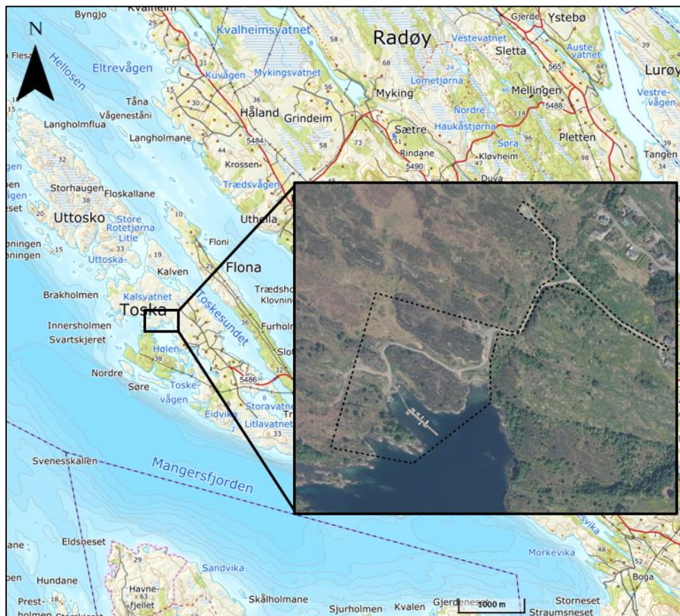
Figur 1: Lokalisering av planområdet, samt omtrentlig avgrensning med sort stiptet linje.

Multiconsult er engasjert av Toska Fritidssenter for å utarbeide en ny detaljreguleringsplan for Toska Campingsenter. Formålet med planen vil være revisjon av gjeldene plan for å legge til rette for utleiehytter i stedet for campingplass. Plassering og avgrensning av planområdet er vist i figur 1 og 2.