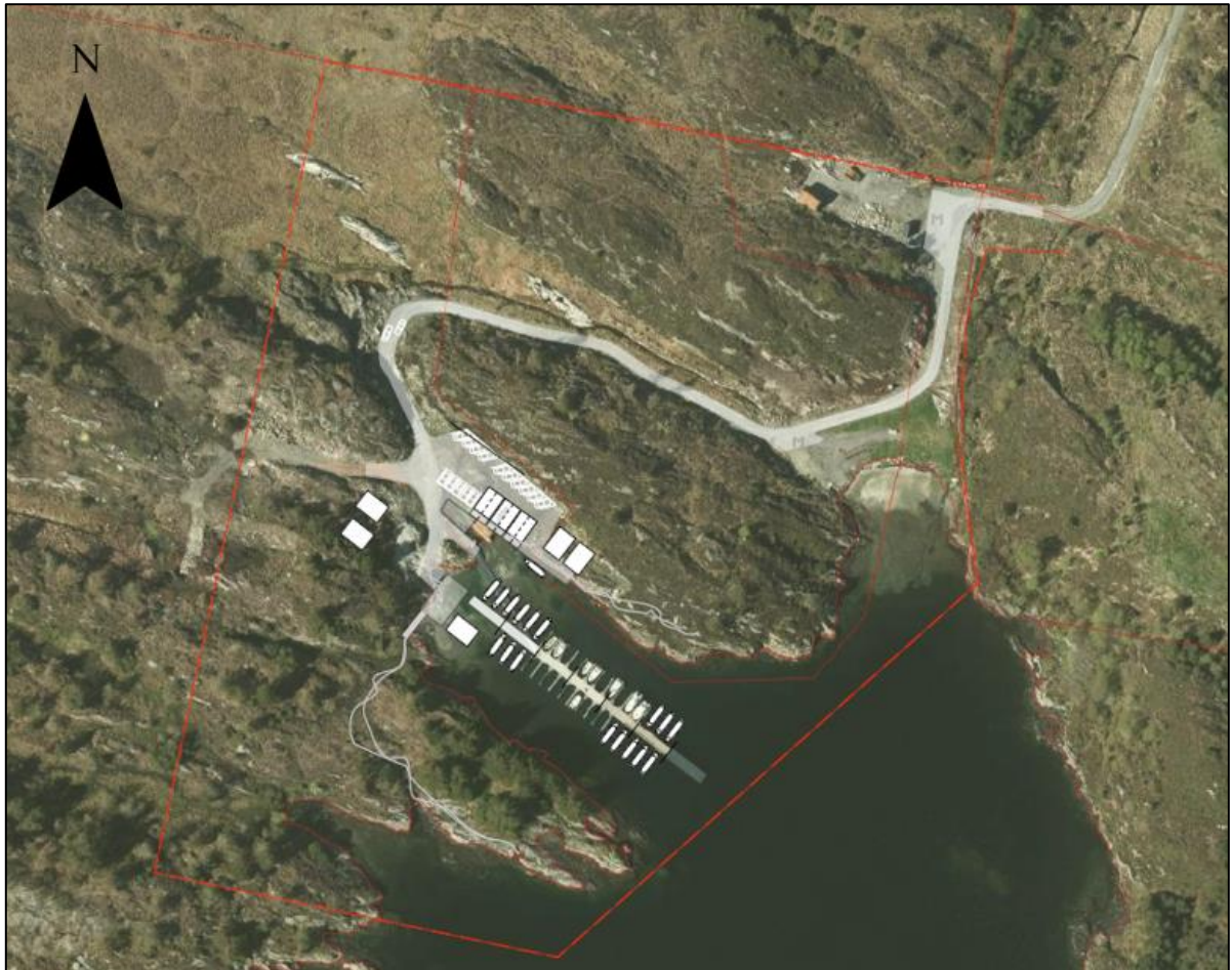
Figur 11: Illustrasjonsplan fra arkitekten. Planen viser at den planlagte utbyggingen på land er i de områder som er mest gjengrodd