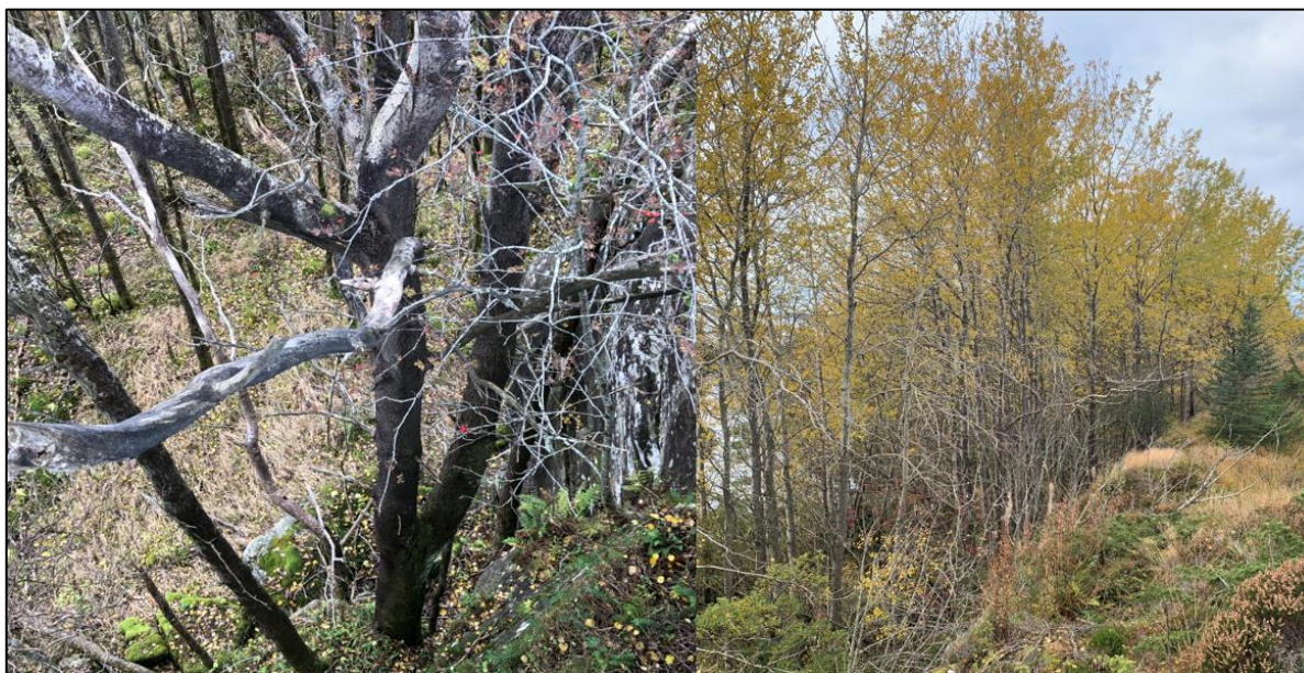
Figur 10: Området med større ospetrær, registrert ca. 20 m sør for planområdet.