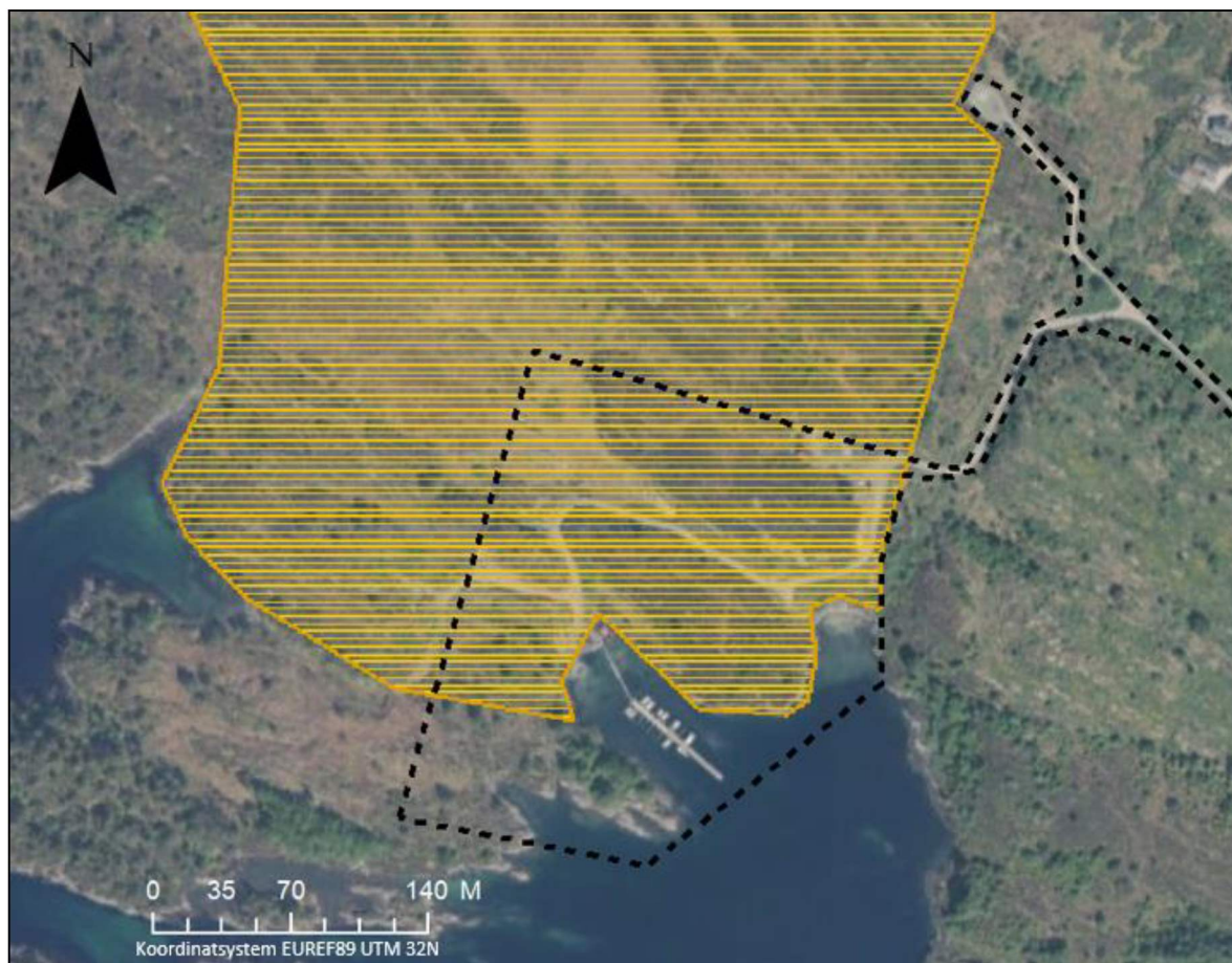
Figur 3: Avgrensning av naturtypen kystlynghei (fattig kystlynghei) fra Naturbase. Planområdet er omtrentlig avgrenset med sort stiplede linje.