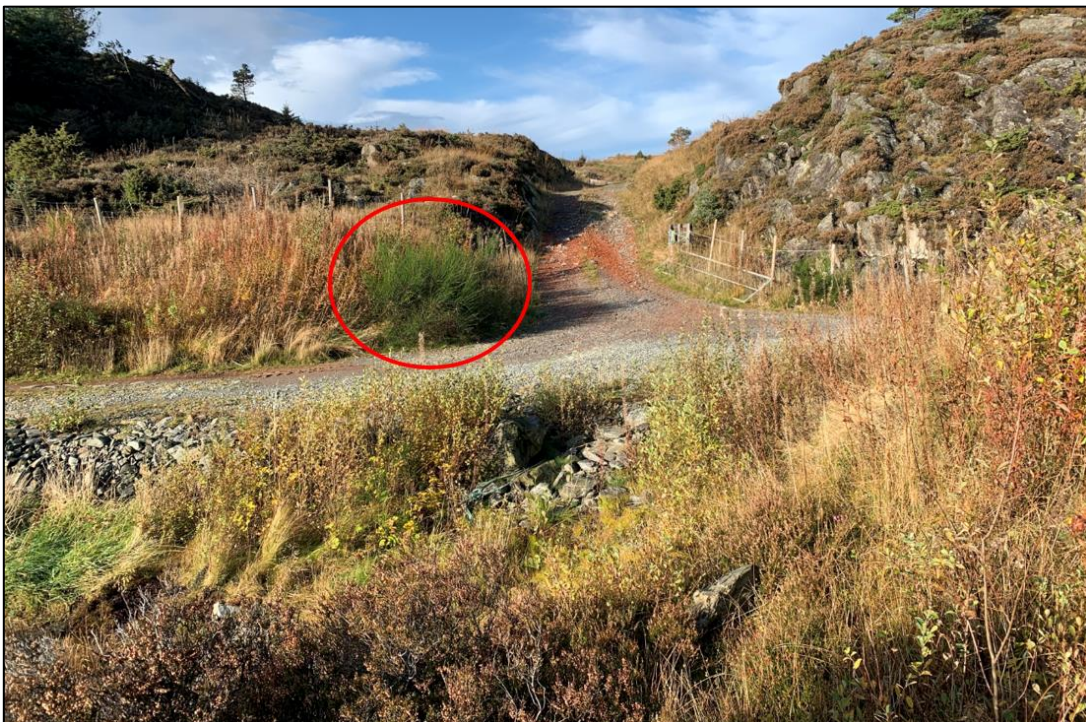
Figur 7: Gyvel, markert med rød sirkel, ved veikrysset mellom kolle 2 og kolle 3. Kolle 3 kan skimtes bakerst til høyre i bildet. Nærmest i bildet vises deler av den fuktige fastmarka som var gjengrodd av blant annet knappsiv og geitrams.