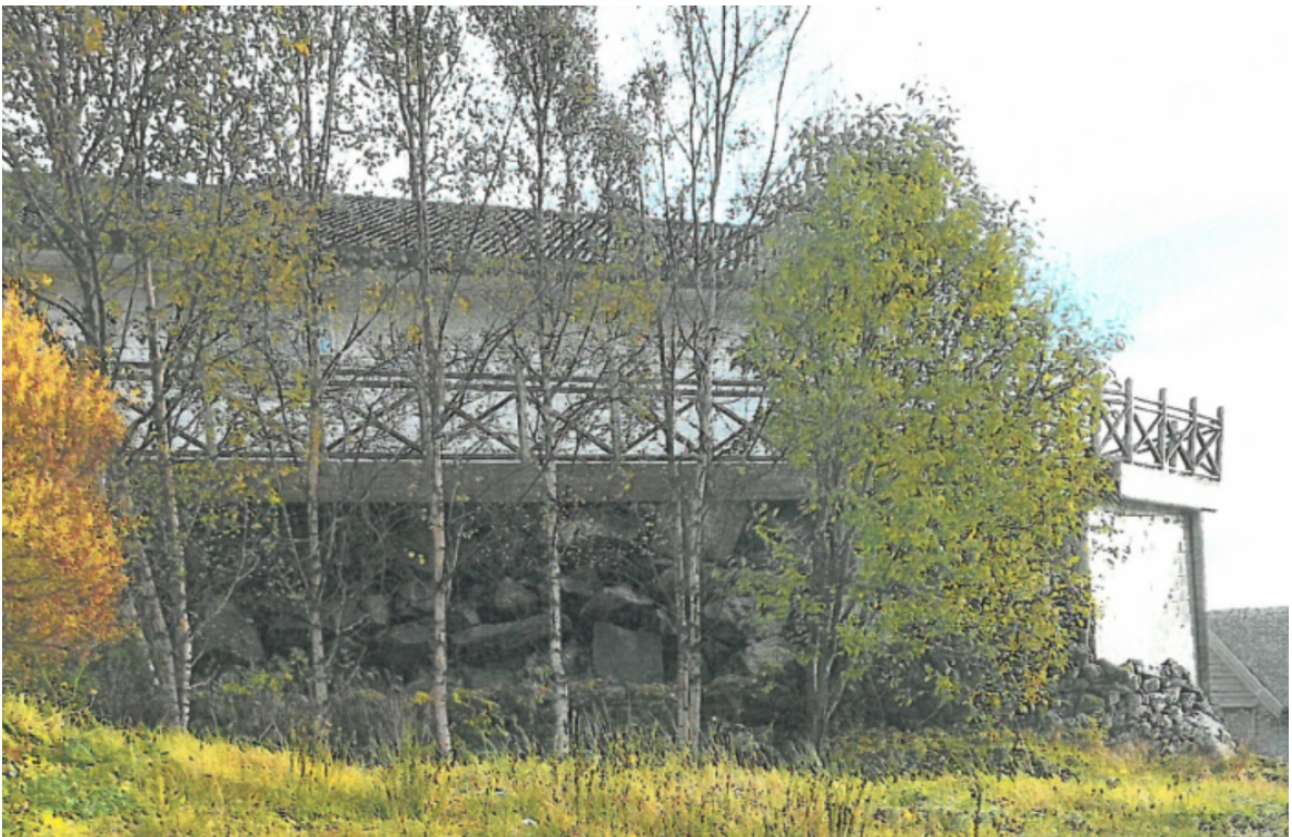
Bilde 3: Tiltaket sett fra nord som grenser mot gbnr. 428/21 (bilde hentet fra advokat Bøe sin klage).