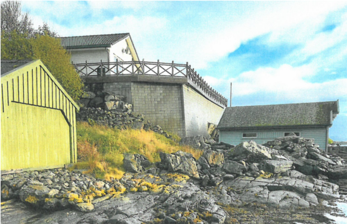
Bilde 2: Tiltaket sett fra nordvest slik det er oppført i dag uten avtrapping

utnyttelsesgraden ikke overskrider 29 % BYA, og at muren langs sjøsiden får en avtrapping hele veien.