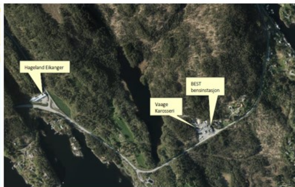
Ortofoto over området

E39 Vikane - Eikangervåg ligg inne som prosjekt nr. 17 i Nordhordlandspakken.