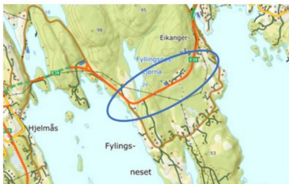
Blå ring syner planområdet

Statens vegvesen legg fram forslag til reguleringsplan for E39 frå Vikane til Eikangervåg. Hovudføremålet med planframlegget er å regulere ny gang- og sykkelveg på strekninga. Reguleringsplanen legg vidare opp til generell utbetring av trafikktryggleik i området gjennom å sikre areal til forsterka midtoppmerking på E39 og utbetring av kryss og avkøyrslar langs strekket.