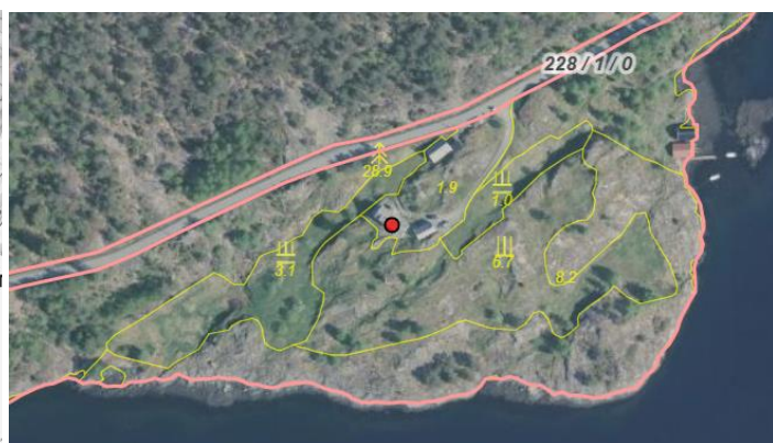
Figur 2 Flyfoto over tunet og jordbruksarealet