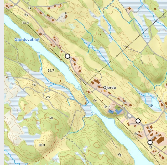
NVDB – ulykker (1000m x 1000m)