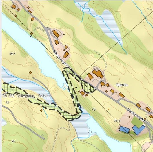
Reguleringsplaner (500m x 500m)