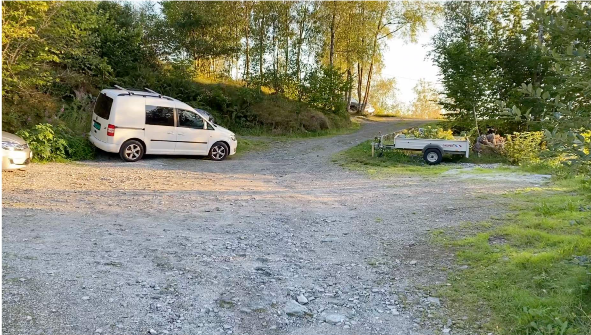
Video av eksisterende veggrunn