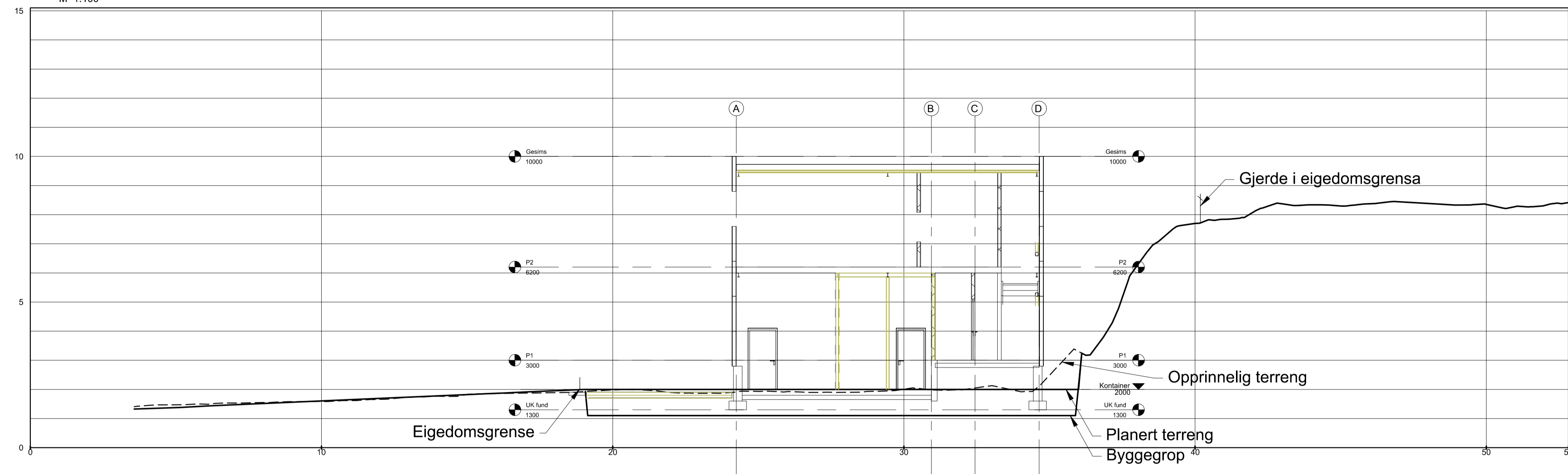
Snitt 1 - Akse 2 M=1:100