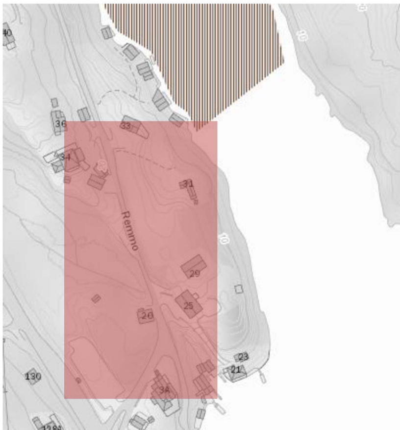
Figur 3: Tiltaksområde vist opp mot gytefelt for torsk.

I Alverstraumen, omtrent der ringledningen får sitt utløp, starter gyteområdet for torsk i Randsundet.