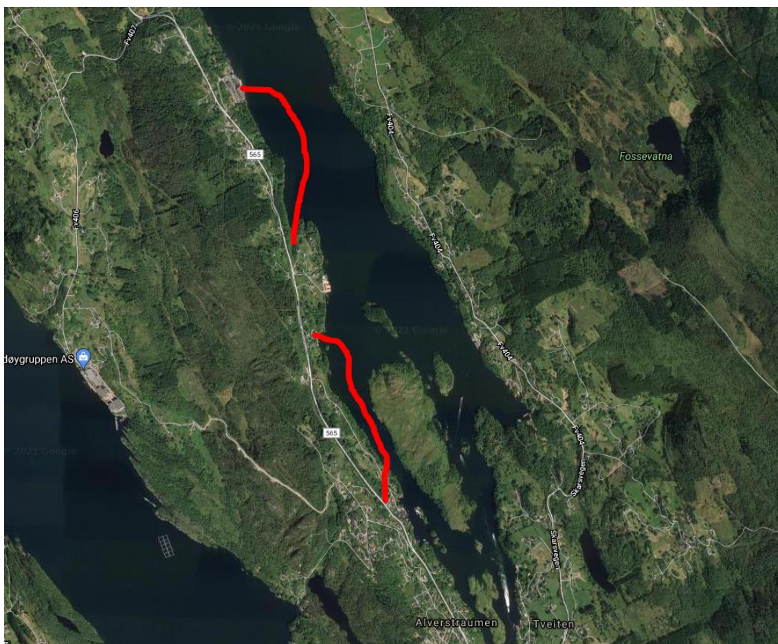
Figur 1: Oversikt over planlagte ledninger – B1 som nå omsøkes, er dens om ligger sør/mot Tveiten.

Omsøkt tiltak er en del av prosjektet «Alverstraumen ringledning», som omhandler etablering av ringledning for drikkevann mellom gamle Radøy kommune og Lindås kommune. Det skal etableres én ringledning, men prosjektet er som nevnt innledningsvis, delt opp i to entrepriser (B1 og B2). B1 er ledning som etableres på land ut i sjø, mens B2 er ledning kun i sjø fordelt på to delstrekninger. Det søkes i første omgang om etablering av B1, mens det for B2 vil sendes inn en egen søknad.