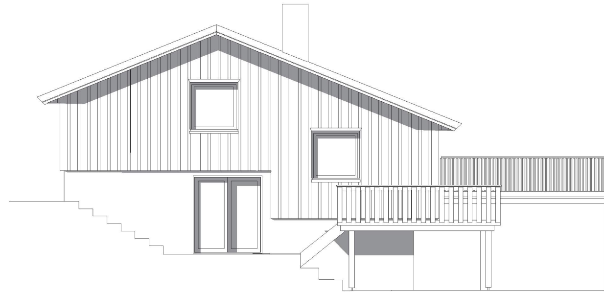
Fasade mot Nord