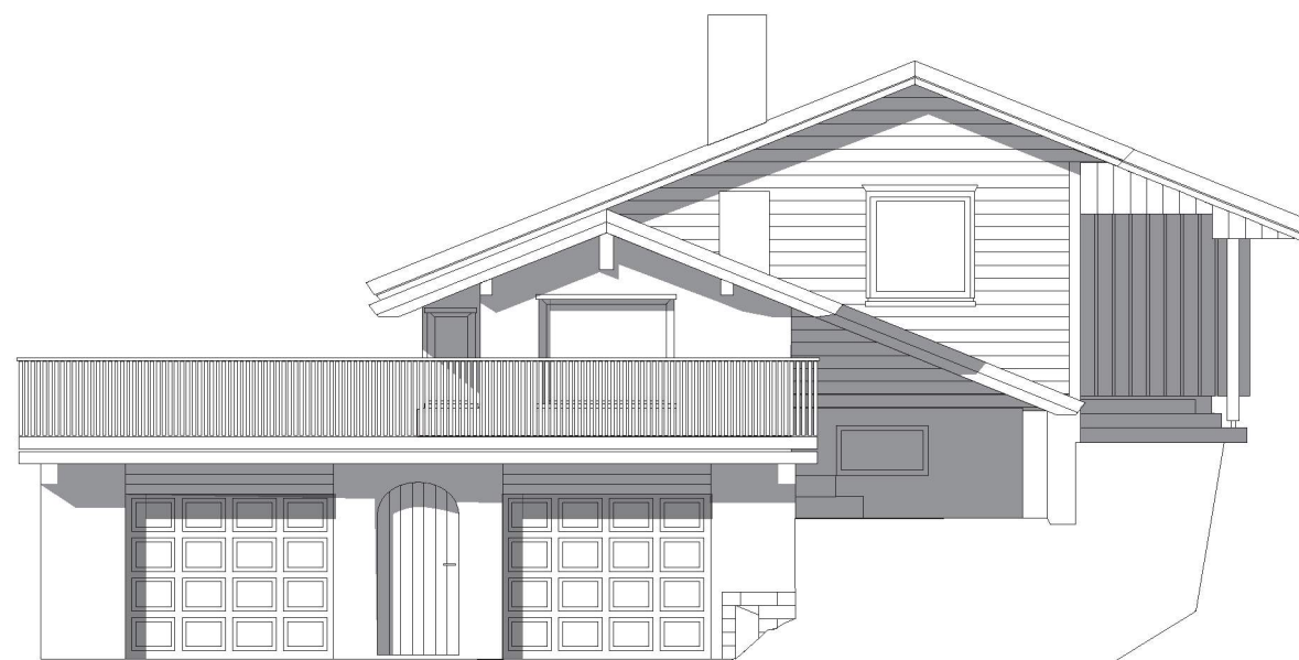
Fasade mot Sør