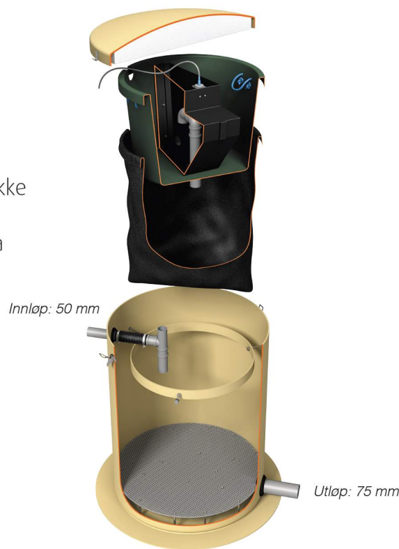
Vera Slamfilter for gråvann uten pumpe Varmekabel er ekstrautstyr.