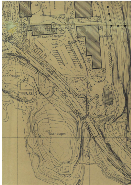
Utsnitt frå kabeltraseen og utsnitt frå reguleringsplan

Vi meiner oversendinga er mangelfull og ber difor om meir dokumentasjon av gjennomføring av tiltaket, og om ein ny frist for uttale.