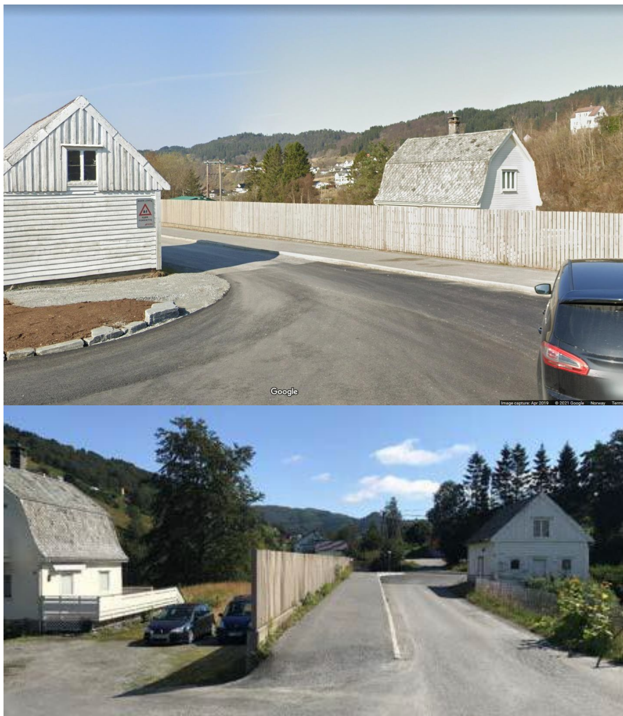
Figur 2 Fuglevikvegen i dag (bilder fra Google og planskildring)

Fordi ein har vald å ikkje ta med seg avkøyrsla frå Fv. 5474 til privat veg Fuglevikvegen må det etter søknad, formelt innhentast avkøyrsløyve frå Vestland fylkeskommune for kvar bueining som skal byggjast. Veglova regulerer formelt dette. Fordi dette ofte vert oversett i byggjesakshandsaminga rår vi til at det vert tatt inn ei føresegn med krav om løyve etter veglova før byggjestart.