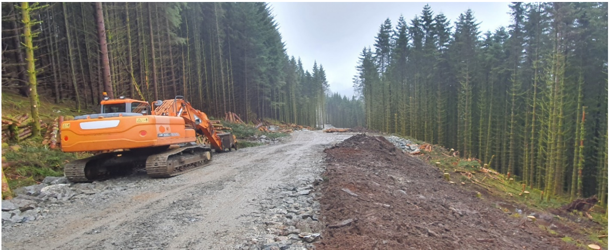
Nær toppen av stinginga. Legg vekt på at det vert ryddig og fint, jordmassar plasser i skråning.