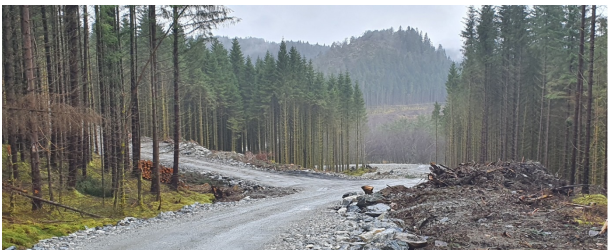
Stigninga opp Seljedalen,

Arealet lengst nordaust og rett sør om Bruramyra er vanskeleg tilgjengeleg. Både ta omsyn til vassdraget og Langavatnet