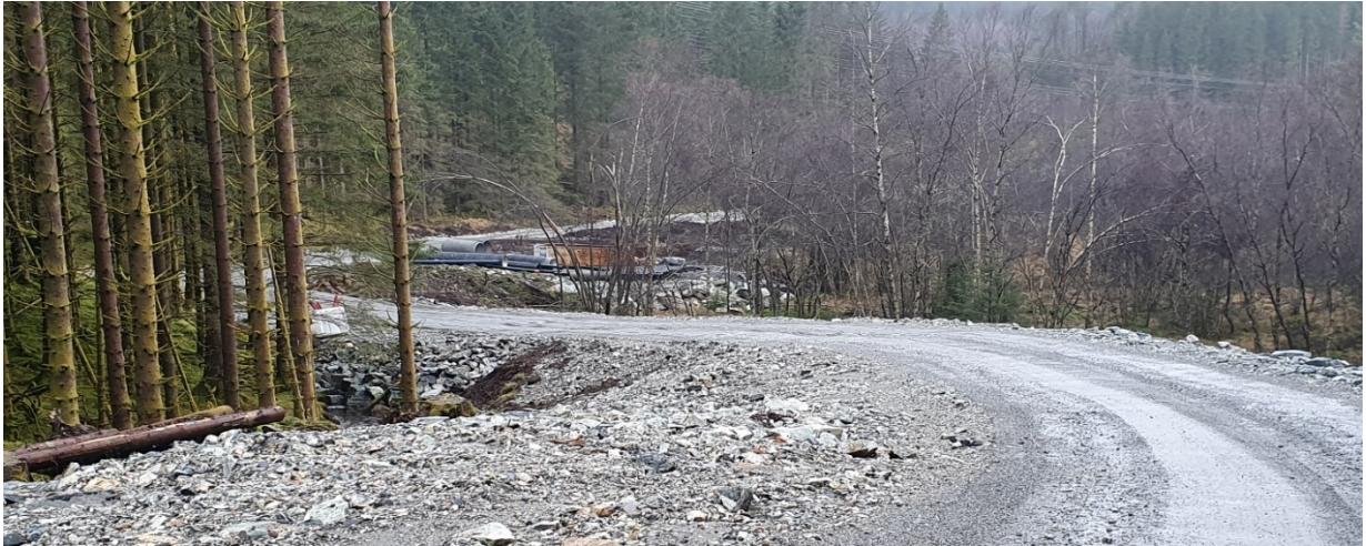
Ved enden av myra og start på stinginga oppover Seljedalen.