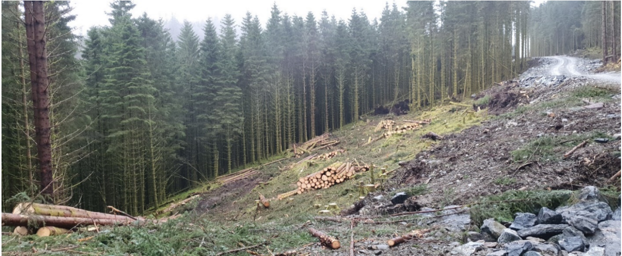
Start på sideveg mot aust og lia mot søndre Åse.