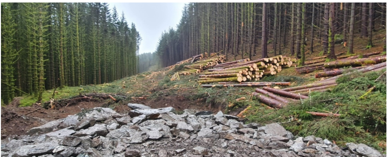
Toppen av stinginga og opna trase sørover mot gamle steingjerde, grensa mot Indre Gjervik.