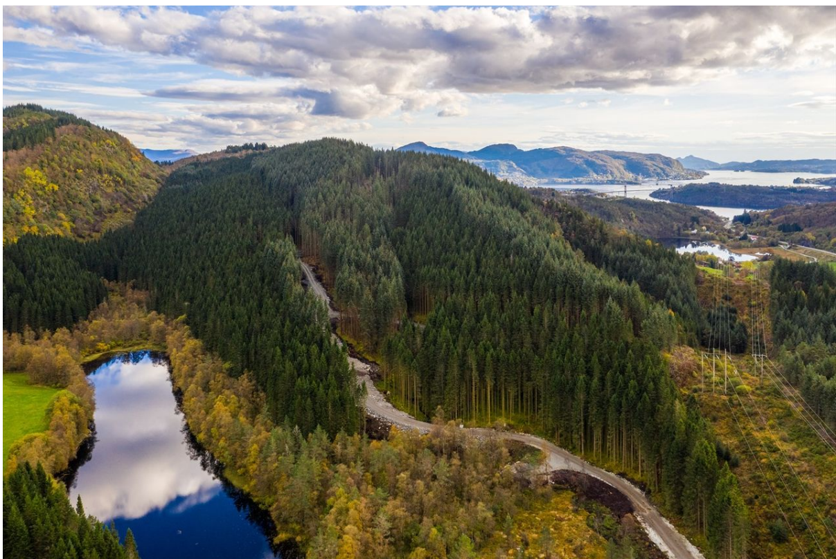
Langevatn mellom Isdal og Åse. Vegtrase sørover Seljedalen.

Sameige har likevel skapt nokre vanskar. Styret har brukt ein del tid på å finne løysingar for korleis innbetalinga til skogfond skal skje. Dette fordi sameige av skog ser ut til å vera uvanleg, og landbrukskontoret har måtta kontakta både statsforvaltaren og departementet for å finna rett måte å oppretta skogfond på. Her har vi gått fleire rundar med kommunen, og pengane er framleis ikkje kome inn på skogfondet. Vi held fram dialogen med kommunen.