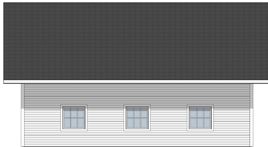
FASADE MOT ØST