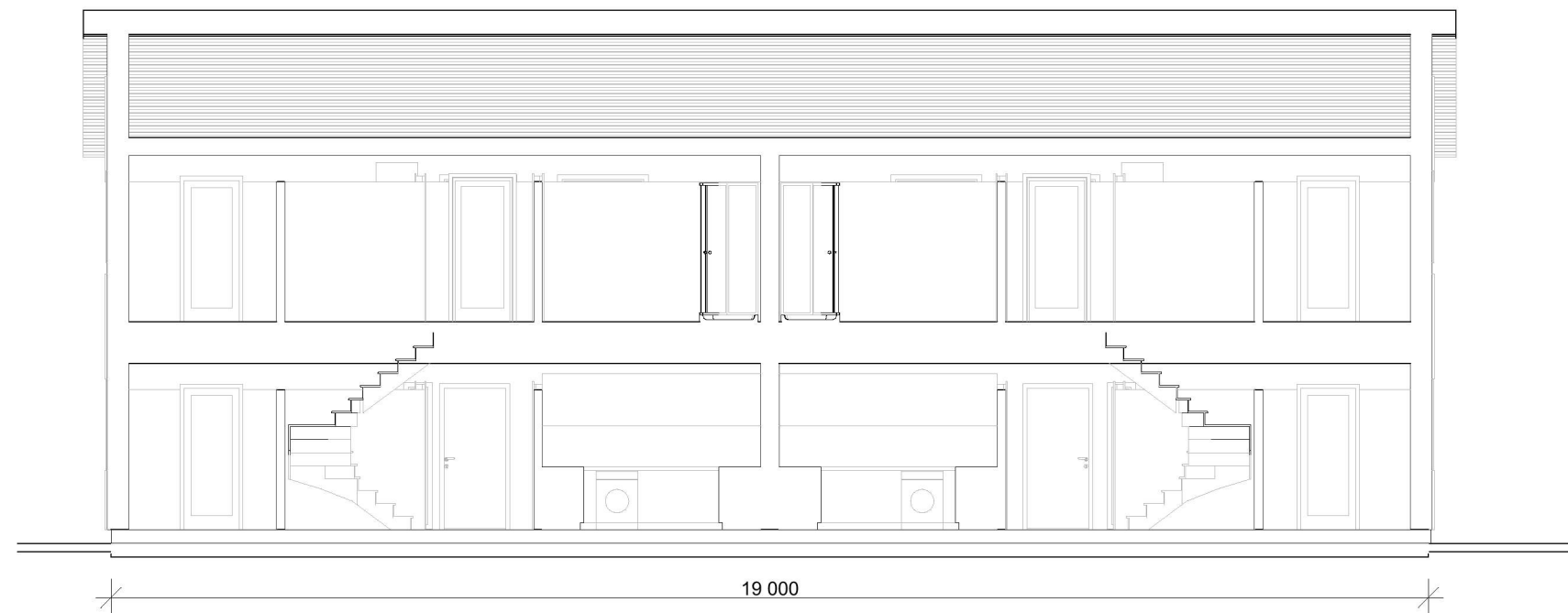
1:100 Snitt B