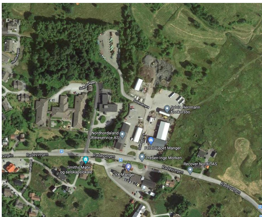
Figur 1: Flyfoto av planområdet

VA-rammeplan med vedlagte teikningar viser prinsipp-løysingane for vassforsyning, spillvass- og overvasshandtering i samband med regulering av Manger sentrum aust. Reguleringsplanen har planID 12602018000300. Hensikta med reguleringsplanen er å leggje til rette for bygging av ny brannstasjon vest for gjenbrukstasjon nord i planområdet på Manger med tilhøyrande tilkomstveg. Fleire avkøyrslar frå fylkesvegen skal i tillegg ryddast opp i med justeringar på veg, fortau og eksisterande bygningsmasse. Det planleggjast ein utviding av dagens barnehage til eksisterande kommunal eigd bygningsmasse som ikkje er i bruk i dag. Uteområdet til barnehagen skal òg utvidast mot elva og fylkesvegen. I tillegg opnar planen for utviding av NGIR sin eksisterande avfallstasjon. Planen har òg som hensikt å samle eksisterande eldre regulerings- og kommunedelplanar til ein samla plan, og arealføremåle vert i hovudsak vidareført med mindre unntak.