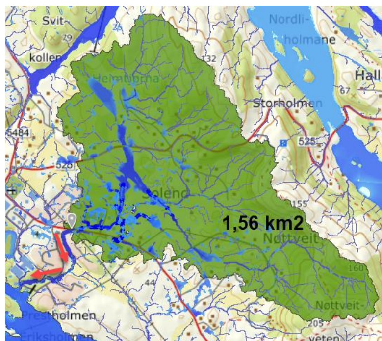
Figur 3: Nedbørsfelt for heile planområdet

Avrenningsvegar samt syv større nedbørsfelt innanfor planområdet er vist på teikning GH102, vedlegg 3. For at elva skal kome tydeleg fram er det manuelt teikna inn omtrentleg avrenningsveg gjennom dei markerte seinkingane.