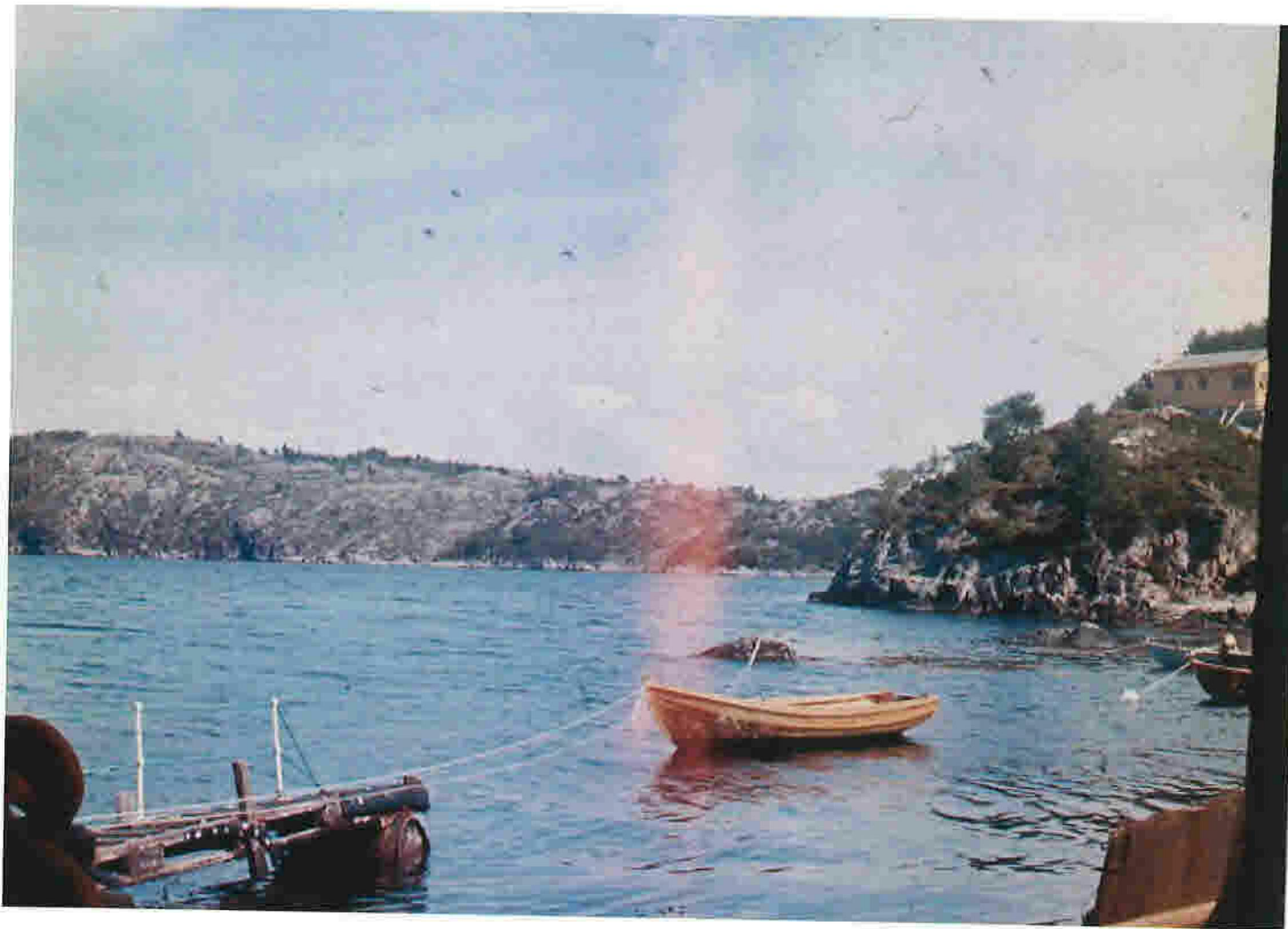
Vedlegg 9 2-5 Bilde 2