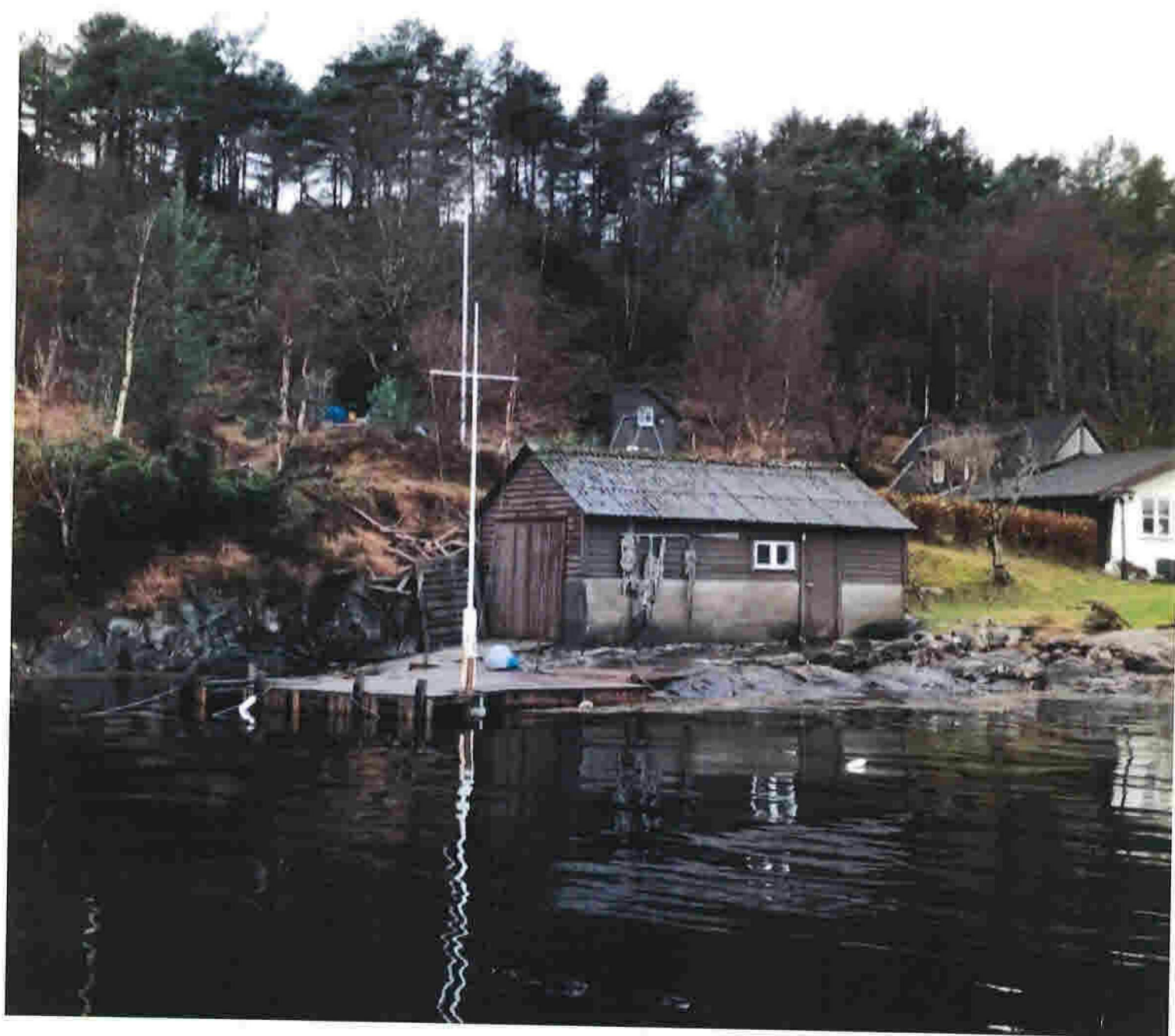
Vedlegg G 5-5 Bilde 5