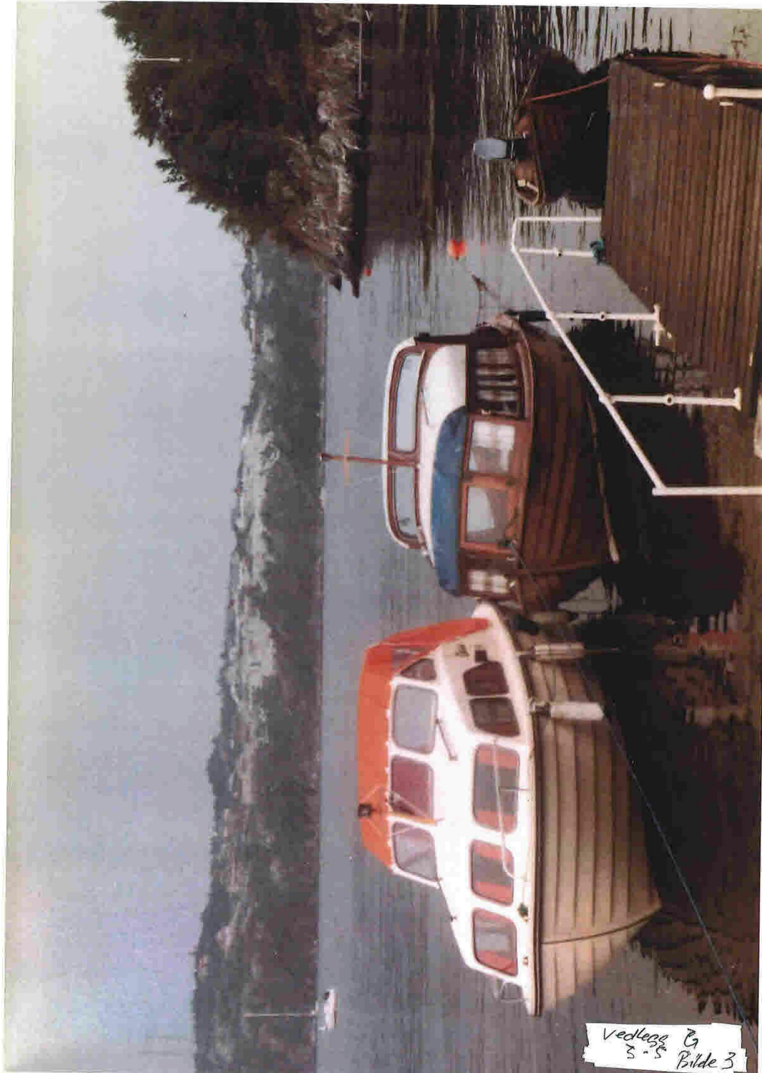
Vedlegg 2 5-5 Bilde 3