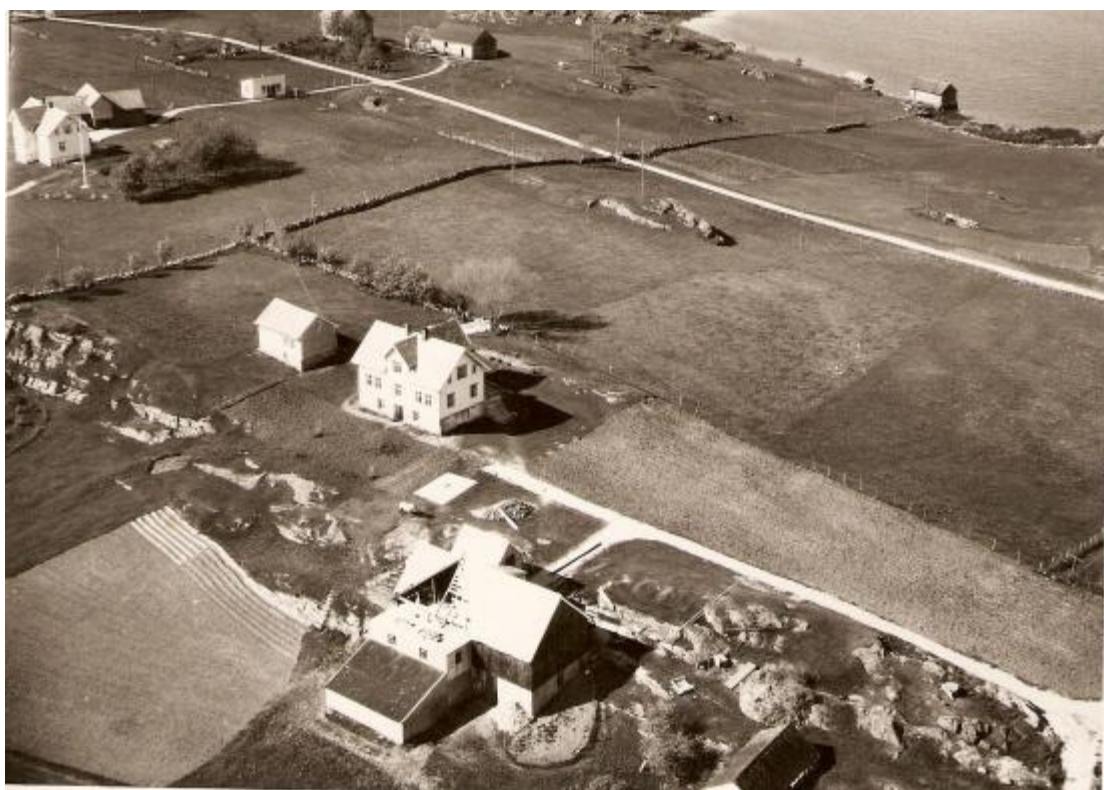
Nevnte tomt, med "gamlastova" og hovedhus i midten. Bildet er tatt på 1950-tallet.

Min far og jeg har vært i aktivt samarbeid med kommunen for å kartlegge kulturminner på Radøy, og vi er begge veldig opptatt av å bevare den lokale historien. Jeg er snart ferdig utdannet historiker, og har ved flere sammenhenger stilt meg til rådighet for Radøy/Alver kommune for å formidle, og bidra i bevaringen av vår lokalhistorie.