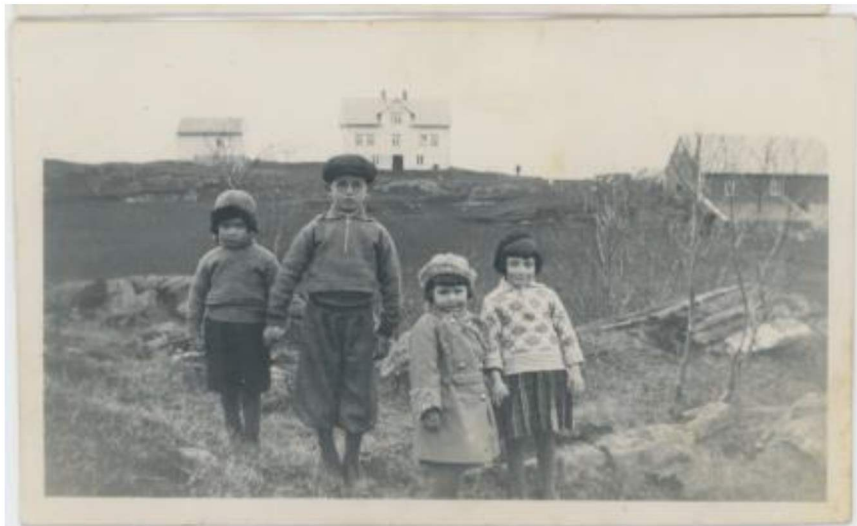
“Gamlastova” til venstre, med hovedhuset i midten. Bildet er antagelig tatt på 1930-tallet.