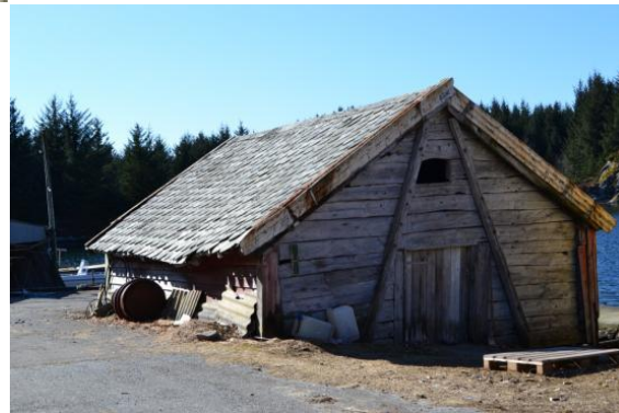
Naustet i dag. Blikkplatene i front kom antagelig på rundt 1950-tallet. Det er kledning på alle sider, unntatt på østsiden (siste bildet).