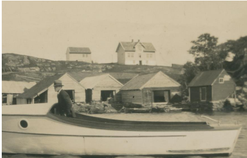
Bilde tatt i Toskavågen, med omtalte naust (2. fra høyre), hovedhuset, og "gamlastova" i bakgrunnen. Bildet er tatt på 1930-tallet.

Utenom det har vi naustet, som antagelig er fra 1800-tallet. Dette bygget er et av de eldste naustene på Toska, og det eneste nauset på sør-Toska som fortsatt har det originale skifertaket. Taket har lenge vært dårlig, og for å unngå kollaps har vi forsterket takbjelkene. Vi har planer om å skifte det råtne undertaket, og beholde skifertaket. Samtidig har vi planer om å fjerne blikkplatene i front, samt skifte ut den råtne kledningen. Dette vil bringe tilbake den opprinnelige fasaden, slik den var før 1950-tallet.