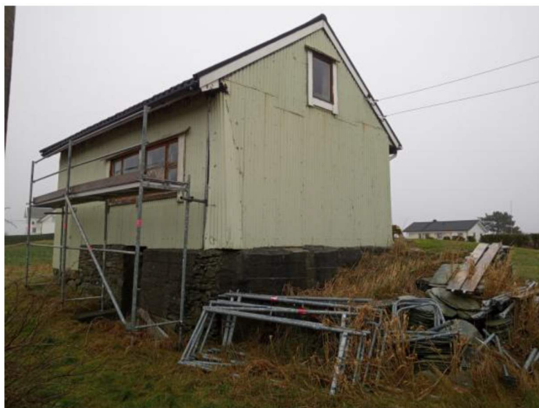
“Gamlastova” i dag. Som det kommer frem har bygget et sårt behov for vedlikehold. Skiferen, som vi på sikt ønsker å sette opp igjen ligger til høyre på bildet. Vinduene er ikke originale til bygget, og vil bli byttet ut med vinduer med sprossevinduer med 6 ruter, av den opprinnelige typen.