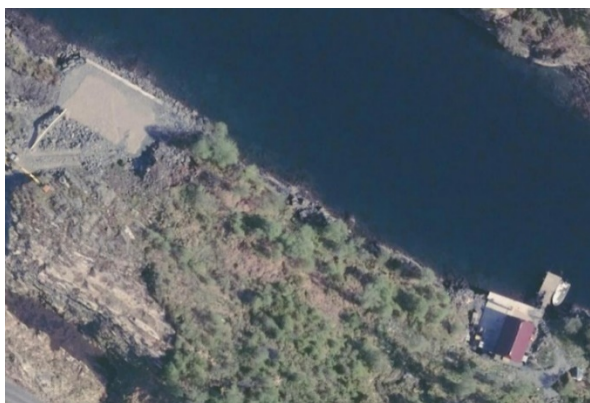
Plassering av de tre naustene (til venstre) i forhold til bnr. 66 og 67 (nederst i høyre hjørne) De tre naustene med kaifront, utfylte steinmasser