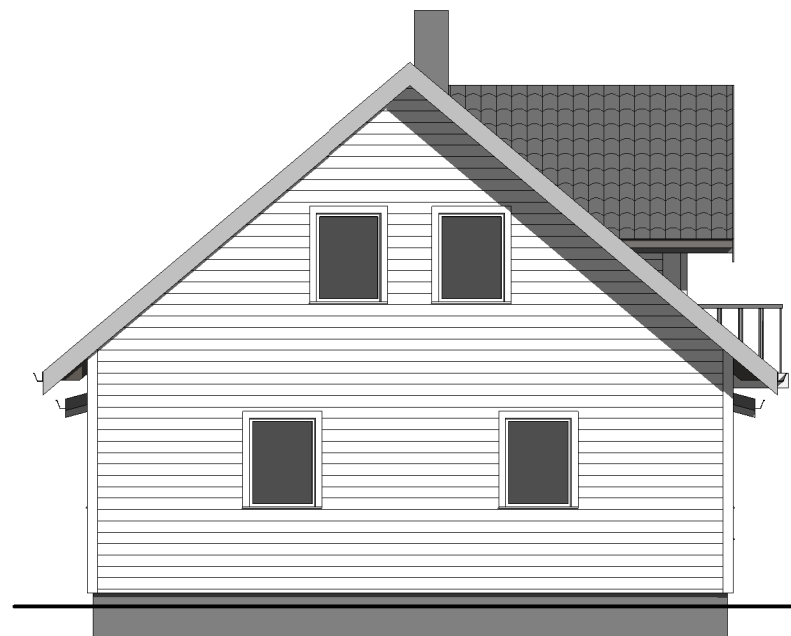
FASADE MOT NORD