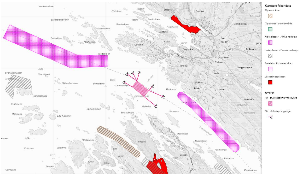
Utsnitt Fiskeridirektoratet sitt kartverktøy