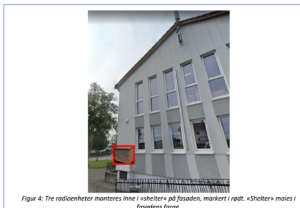
Figur 4: Tre radioenheter monteres inne i «shelter» på fasaden, markert i rødt. «Shelter» males i fasadens farge.