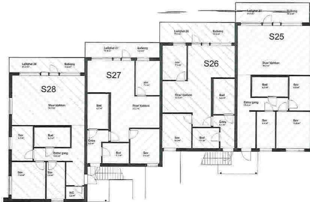
1:100 2. Etasje