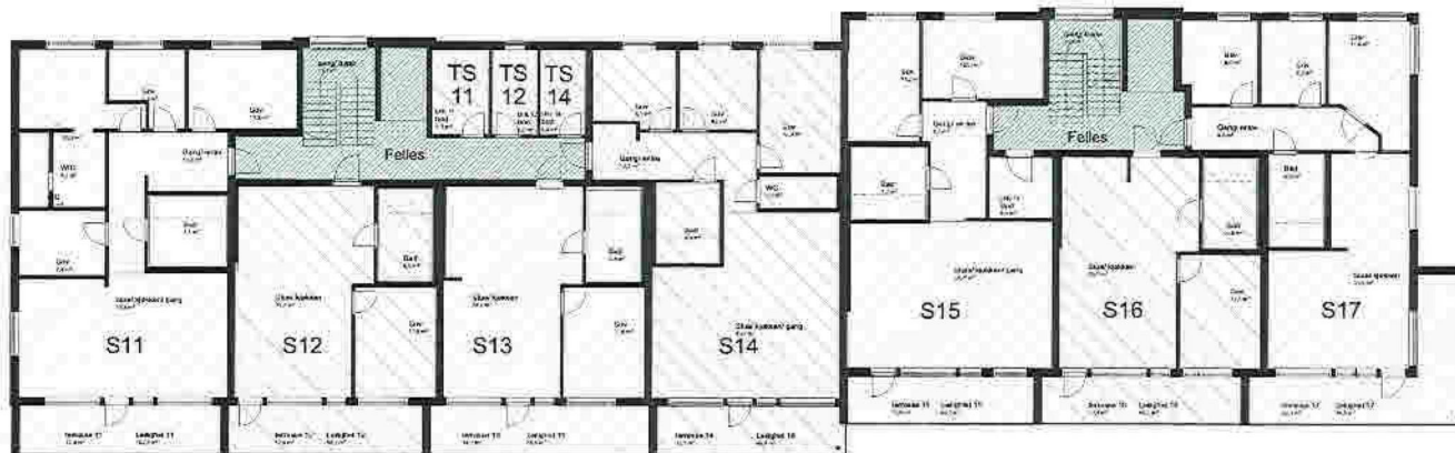
1:100 1. Etasje