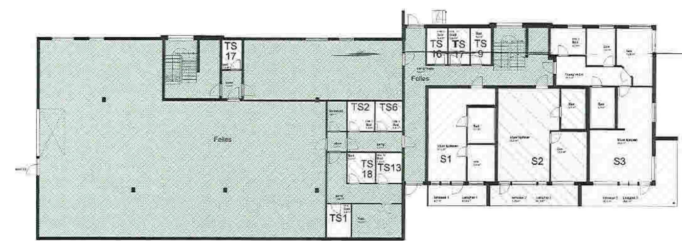
1100 1. Etasje