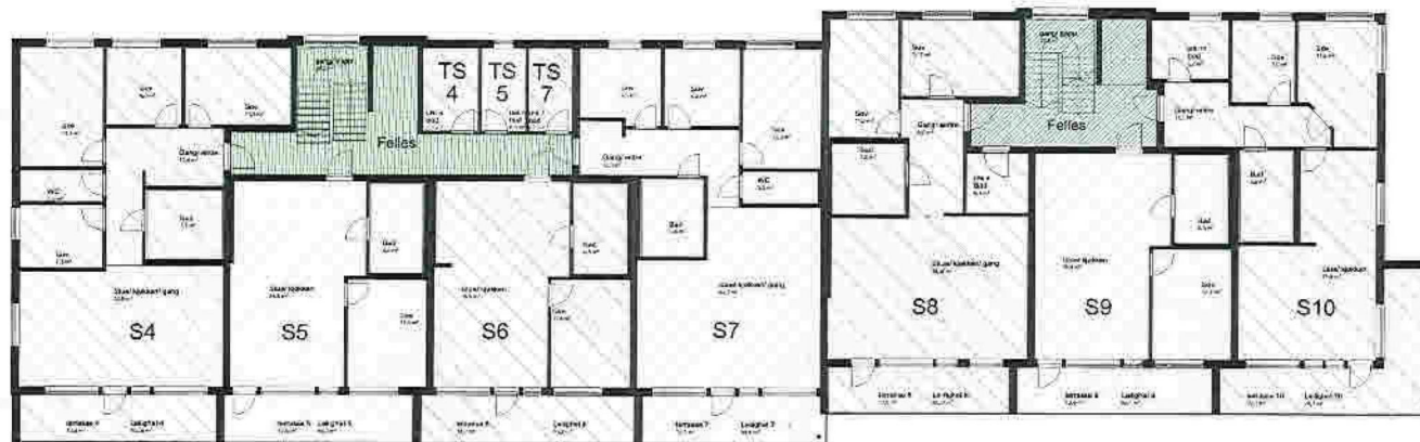
1106 2. Etasje