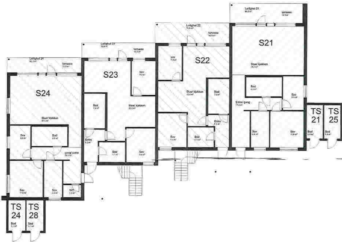
1:100 1. Etasje