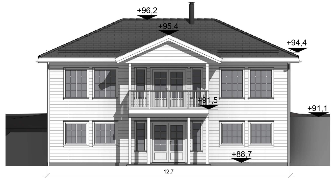
sørvest 1 : 100