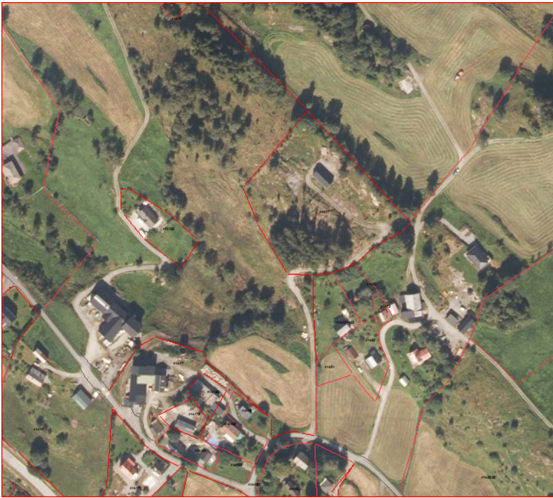
Figur 2 Ortofoto 2020