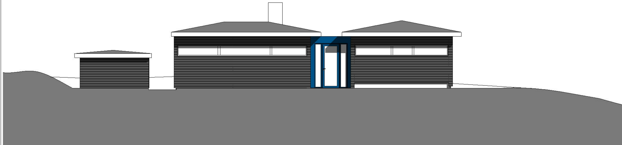
Fasade mot sørvest 1 : 100