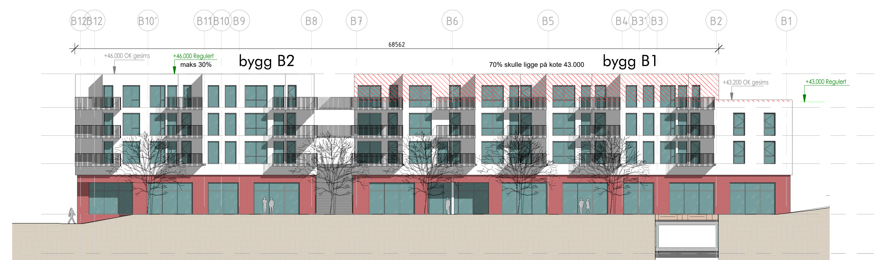
Fasade Nord B1-2 (sett fra Kvasnesvegen) 1 : 250