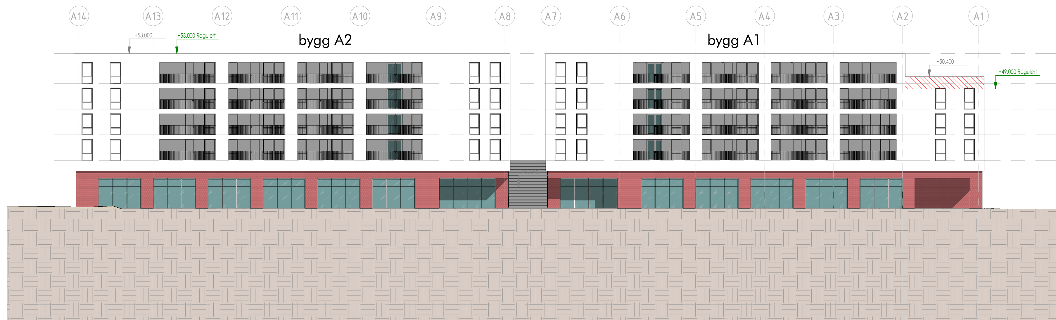
Fasade Nord A (sett fra Lygnvegen /E39) 1 : 250