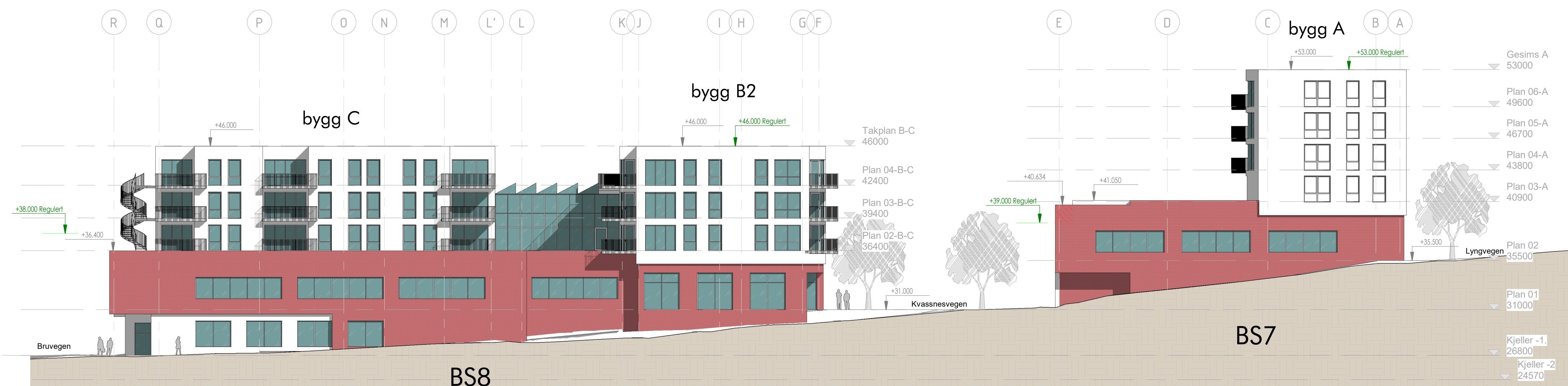
Fasade Øst (sett fra Bruvegen) 1 : 250