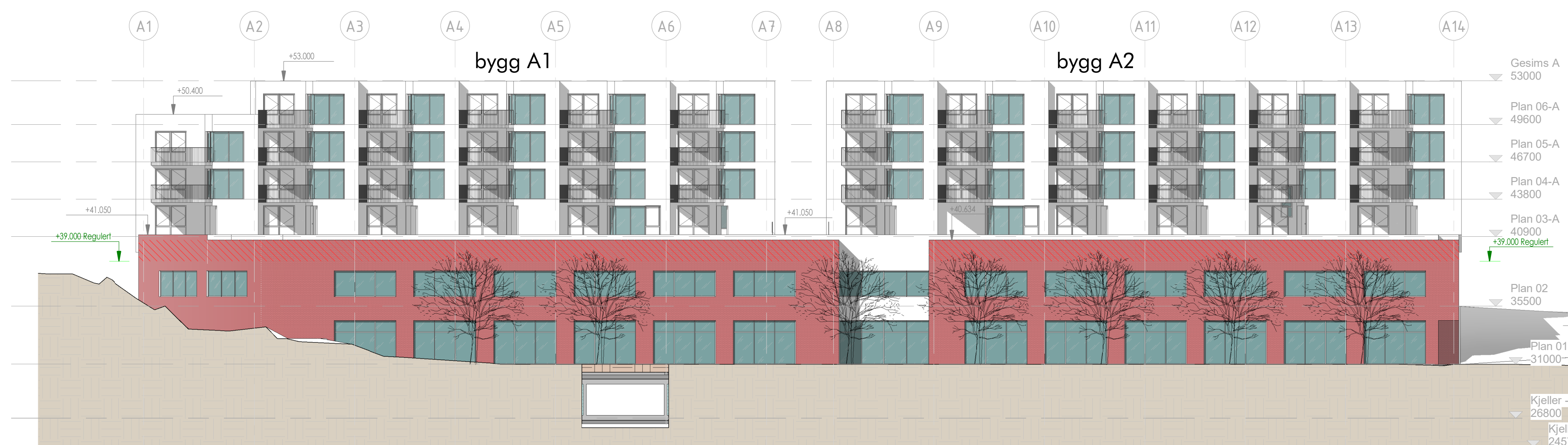
Fasade Sør A (sett fra Kvasnesvegen) 1 : 250