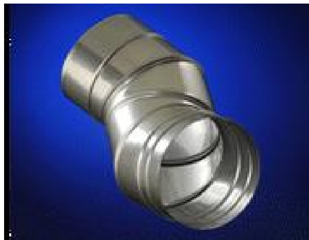
Fig. 1 Schiedel Prima Plus (fra www.schiedel.co.uk).

Schiedel Prima Plus tilfredsstillter kravene i henhold til NS-EN 1856-2:2009.