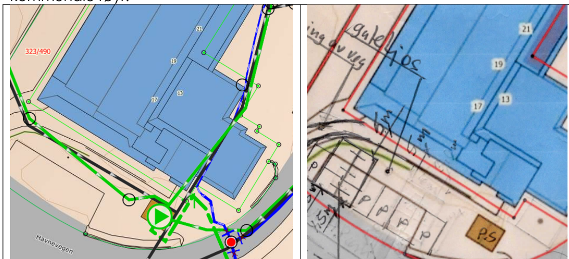
Oversikt over kommunale røyr