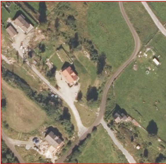
Figur 3 Ortofoto 2020