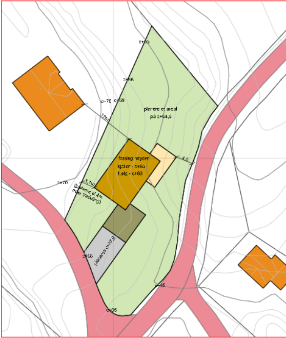
Figur 1 Frå situasjonskartet.