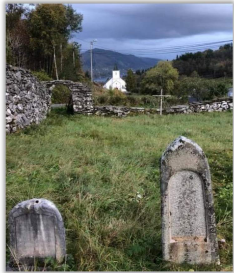
2 Kyrkjegarden frå middelalderen

Ikkje langt frå kyrkja står prestestova som er bygd med tømmer frå den gamle tømmerkyrkja frå 1606.