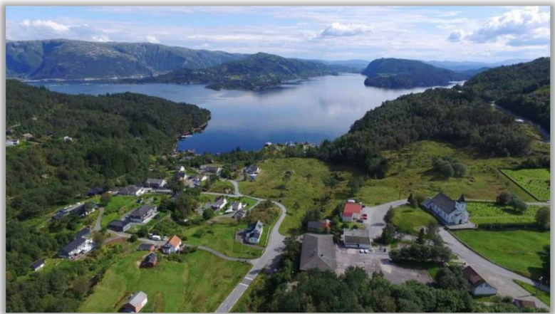
1 Oversiktsbilete Myking

Me ser det er lagt vekt på å bruka heile kommunen, noko me meiner er sjølv sagt, med så mange flotte bygder som finst i Alver kommune. Det er også betryggjande å registrera at dei bekymringane me hadde rundt sentralisering på grunn av byvekstavtalen ikkje ser ut til å verta ein realitet.