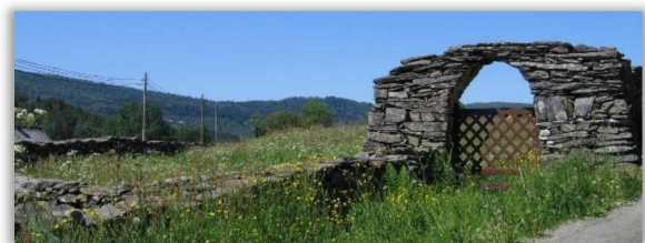
3 Kyrkjegarden frå middelalderen

Våren 1951 vart det funne ei Vikingtids branngrav på Myking. I utgravinga som følgde vart det funne mange gjenstandar, m.a eit Vikingsverd og stridsøks av jern som viser busetnad tilbake til Vikingetida (som var i perioden år 739 – 1066), så det har vore busetnad på Myking i meir enn 1000 år.