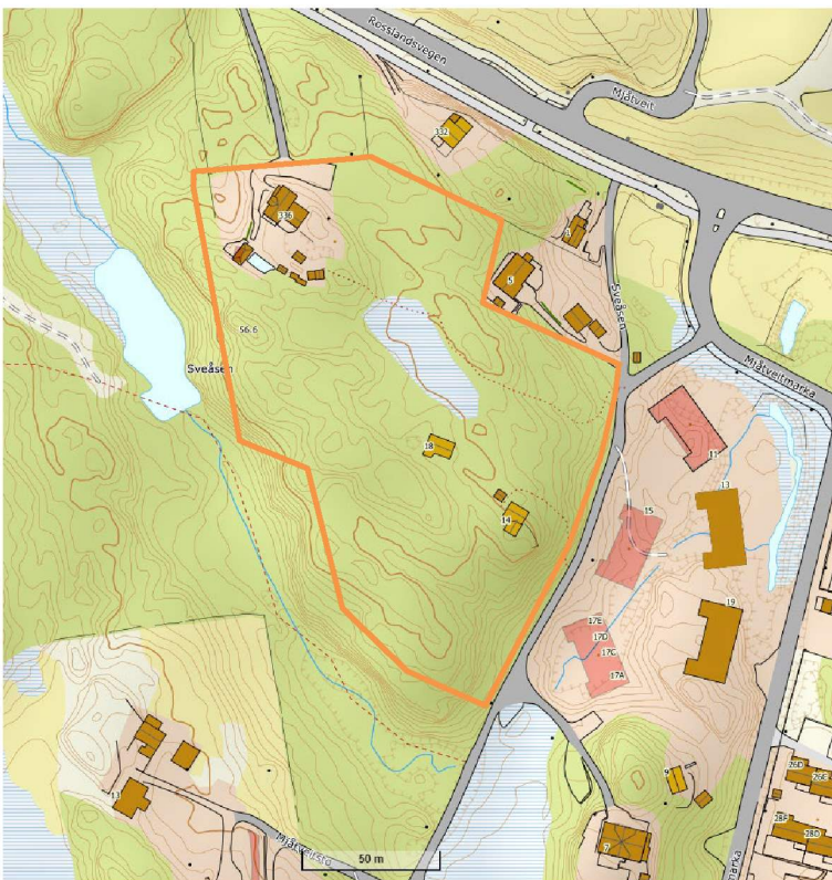
Figur 2 Kartutsnitt fra seeiendom.no. Felt B1a, B1b og B3 i reguleringsplan markert med oransje.

Byggeområdet ligger relativt isolert fra resten av Mjåtveitmarka, men vil også være synlig fra omgivelsene på grunn av beliggenheten på høyden.