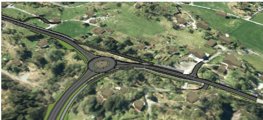
A2 sett frå nordaust. Nipane hyttefelt nedre til høgre og deler av Fløksand i bakkant.

Ny veg er dimensjonert for 80 km/t og med 7,5 m vegbreidde mellom Fløksand og Ryland. Ved Fløksand og Ryland/Vikebø er det gjort tilpassing for å unngå for store inngrep i lokalmiljøet i grendene, og vegen er dimensjonert for 60 km/t og med 6,5 m vegbreidde. På strekninga frå kryss med Bjørndalsvegen til nytt kryss mot Leiro sør for Steinberget er det også nytta dimensjonerande fart 60 km/t av omsyn til dei to kryssa, av omsyn til gåande og syklende i Bjørndalsvegen som må krysse ny fylkesveg, og for å redusere inngrep i og mot Rylandsvatnet.