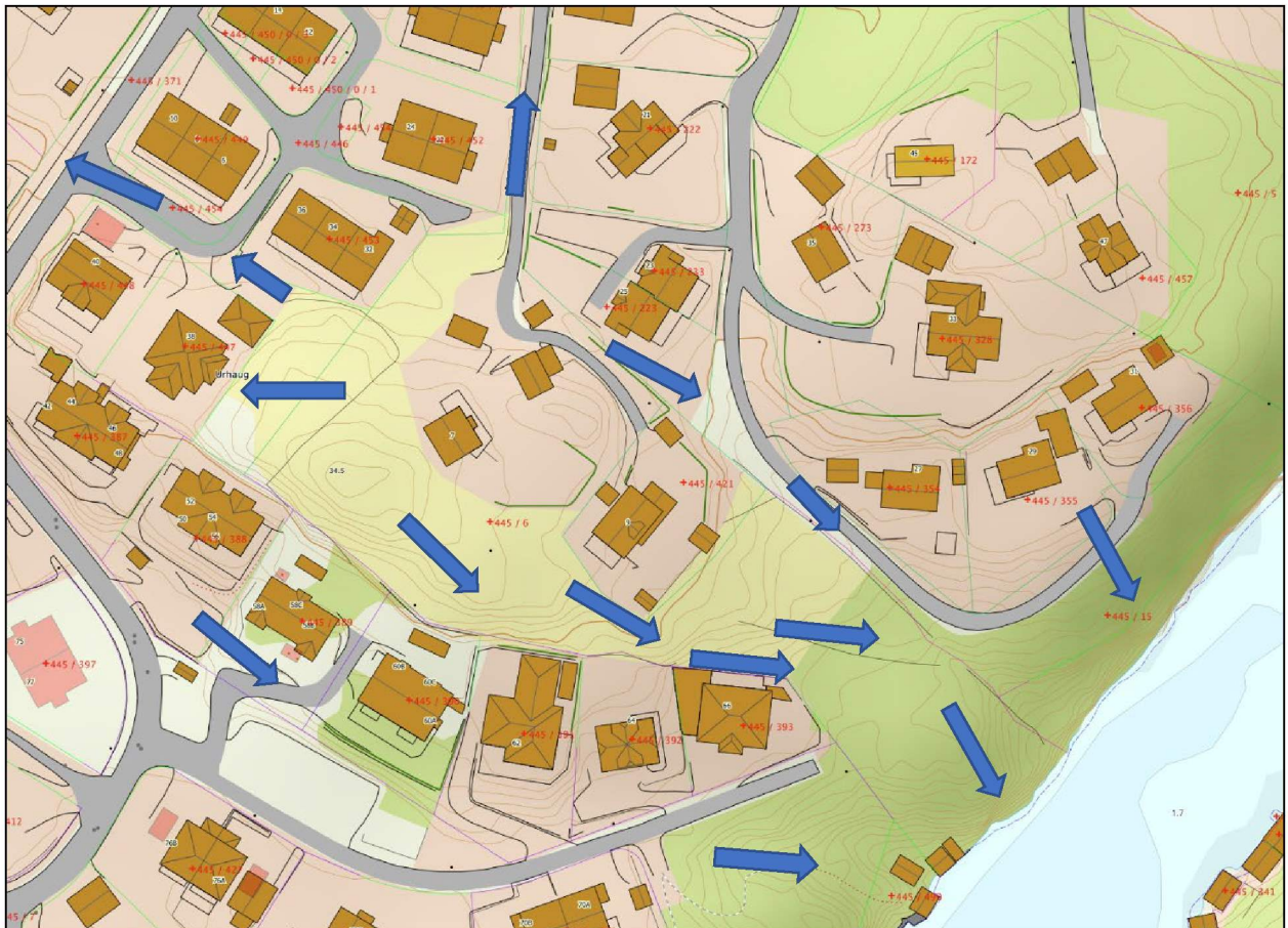
Figur 4. Lokalt nedbørfelt og avrenning frå dette.

Som vist på figur 4 ligger planområdet på et høydetrass og har avrenning til alle kanter. Dette fører til at en må håndtere og sikre avrenningen av overvann der denne renner ned mot eksisterende bebyggelse.