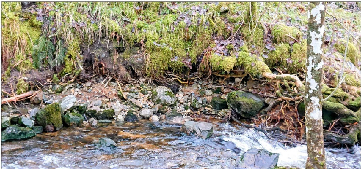
Figur 3. Naturleg erosjonssikring langs vassdrag. Røter bind jorda saman og hindrar at jorda forsvinn ut i vassdraget.