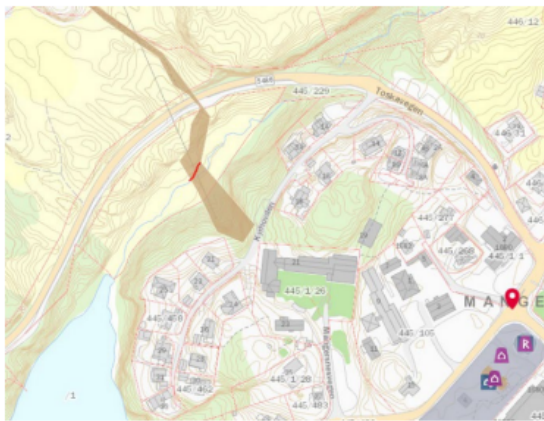
Kulturminneoversikt frå miljoatlas.no