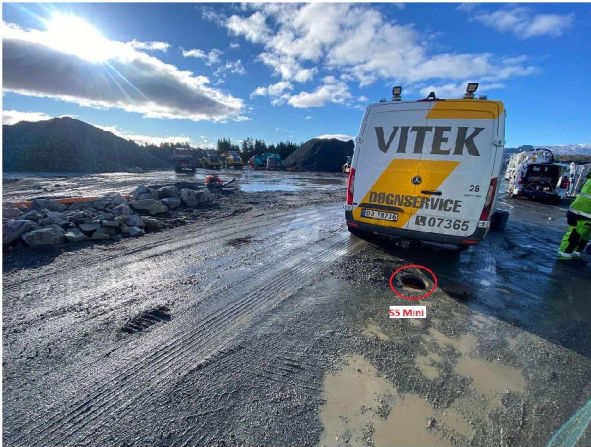
L2252022 105652 AM_S14 Mini_S5 Mini_250222_111433_9.jpg, 00:00:00, 0.80m Start inspeksjon, 0% / S5 Mini