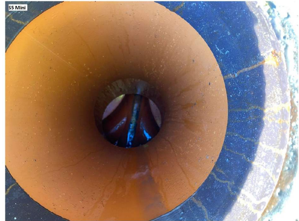
L2252022 105652 AM_S14 Mini_S5 Mini_250222_111433_10.jpg, 00:00:00, 0.80m Start inspeksjon, 0% / S5 Mini