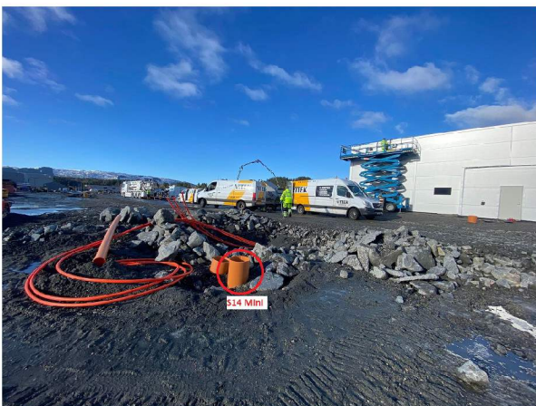
L2252022 105652 AM_S14 Mini_S5 Mini_250222_111433_11.jpg, 00:03:13, 11.40m Inspeksjon fullført / i S14 Mini