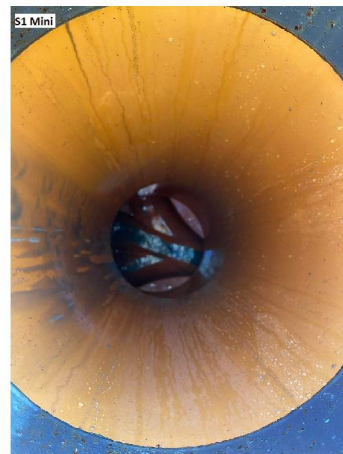
L2252022 105949 AM_S2 Mini_S1 Mini_250222_142803_48.jpg, 00:05:06, 31.90m Inspeksjon fullført / S1 Mini