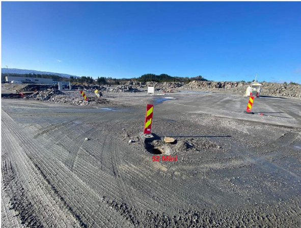
L2252022 105949 AM_S2 Mini_S1 Mini_250222_142803_45.jpg, 00:00:00, 0.00m Start inspeksjon, 0% / S2 Mini