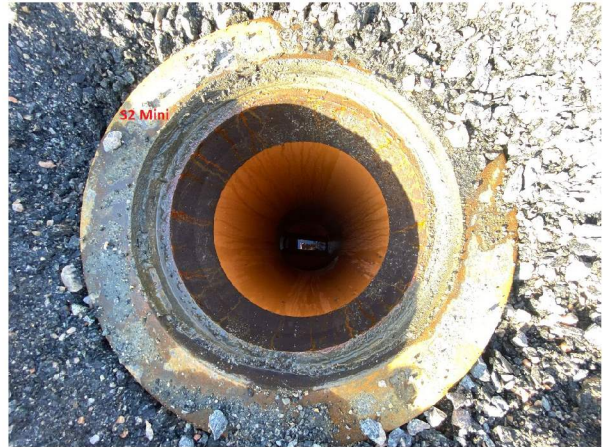
L2252022 105949 AM_S2 Mini_S1 Mini_250222_142803_46.jpg, 00:00:00, 0.00m Start inspeksjon, 0% / S2 Mini