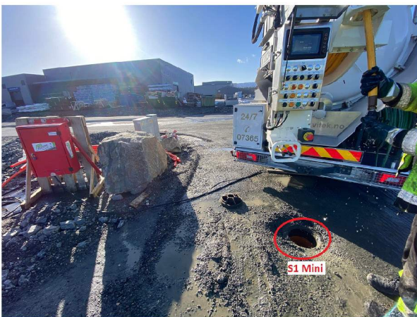
L2252022 105949 AM_S2 Mini_S1 Mini_250222_142803_47.jpg, 00:05:06, 31.90m Inspeksjon fullført / S1 Mini